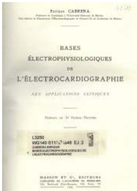
Figura 1 Libro de Electrocardiografía, por el Dr. Enrique Cabrera (París, 1950).

eléctricas de las sobrecargas sistólica y diastólica de los ventrículos, así como las de hipercarga, por ejemplo en la vagotonía. Dichos estudios se continuaron más tarde, extendidos a los grados intermedios de sobrecarga 11,12 , a las correlaciones electrohemodinámicas durante la realización de sobrecargas experimentales progresivas en presencia y ausencia de pericardio 13 . Asimismo se han estudiado, en la comunicación interauricular 14 , las variaciones postoperatorias precoces y tardías de los datos electrocardiográficos de