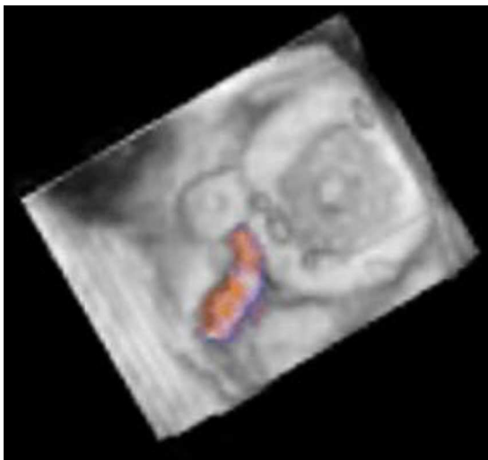
Figura 1 Imagen de ecocardiograma transesofágico tridimensional de la prótesis valvular mecánica en posición mitral en sístole ventricular. Se observa la válvula mecánica cerrada, el Amplatzer® Duct Occluder (St. Jude Medical) previamente colocado y la fuga paravalvular residual demostrada por doppler color.

Presentamos la imagen ecocardiográfica transesofágica tridimensional del resultado exitoso de cierre percutáneo de una fuga paravalvular mitral residual con un dispositivo Amplatzer® Vascular Plug III (St. Jude Medical), después del procedimiento inicial de cierre percutáneo con dispositivo Amplatzer® Duct Occluder (St. Jude Medical). Varón de 64 años con antecedente de cambio valvular mitral por prótesis mecánica St. Jude hace 4 años y fuga paravalvular importante a los 4 meses del evento quirúrgico, por lo que fue cerrada en forma percutánea con un dispositivo Amplatzer® Duct Occluder (St. Jude Medical), persistiendo la fuga paravalvular residual ligera (fig. 1). Durante el seguimiento de 2 años ingresó varias veces en urgencias