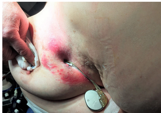
Figura 1 Generador y electrodos del marcapasos, surgiendo a través del surco submamario derecho.

Presentamos el caso de una mujer de 80 años, con antecedentes de diabetes mellitus tipo 2 e hipertensión arterial controladas adecuadamente, portadora de marcapasos (MP) bicameral en modo DDD debido a bloqueo auriculoventricular completo hace 12 años. Actualmente, acude al observar un cuerpo extraño en el surco submamario derecho, lugar donde había recibido tratamiento previo con antimicóticos tópicos por presentar signos inflamatorios con sospecha de micosis, sin realizar control del MP. Al momento de la consulta se encontraba normotensa, afebril, y con una frecuencia cardíaca de 60 lpm debido a estimulación permanente de su MP, con ritmo sinusal basal. Al examen se objetivó el generador extruido a través del surco descrito, evidenciándose adecuada conexión con los electrodos (fig. 1). La radiografía de tórax mostraba el MP fuera de la cavidad torácica, con electrodos adecuadamente ubicados en aurícula y ventrículo derechos (fig. 2). Dada la contaminación del sistema, se realizó tratamiento