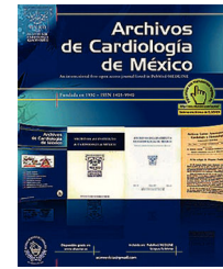
IMAGEN EN CARDIOLOGÍA