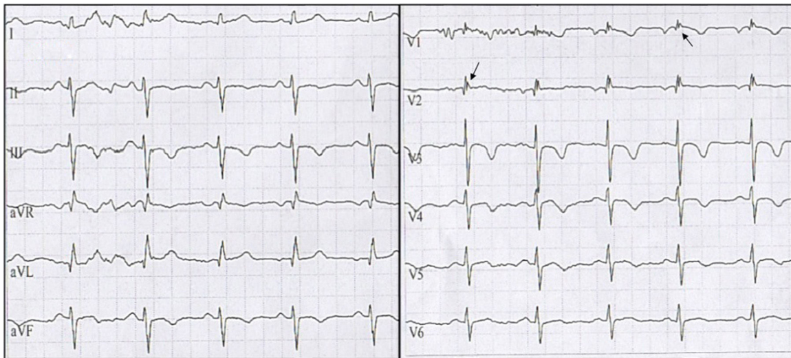
Figura 3 ECG en ritmo sinusal, las flechas señalan onda épsilon en derivaciones V1-V2. Además, presencia de inversión de ondas T de V1 a V4.

interventricular y repolarización miocárdica (fig. 3). Dada la evolución de la paciente se realizó una revisión exhaustiva de historia clínica encontrando que la paciente tenía características que podían indicar M/DAVD por lo cual se aplicaron los criterios de Task Force concluyendo que al cumplir con más de 2 criterios mayores, la paciente presentaba un diagnóstico definitivo de esta enfermedad, por lo cual se indicaron estudios genéticos los cuales se encuentran pendientes a la fecha.