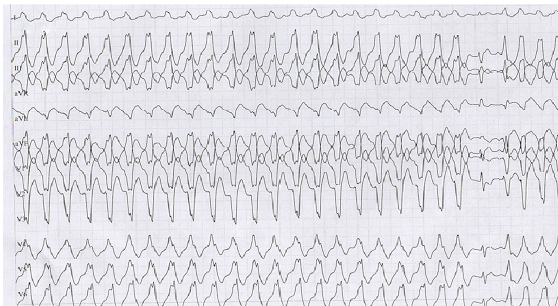
Figura 1 Taquicardia ventricular sostenida monomórfica en prueba de esfuerzo con imagen de bloqueo de rama izquierda.