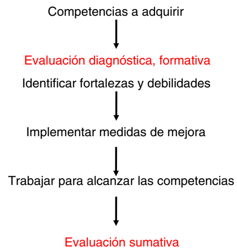
Figura 1 Proceso de la evaluación-formación.

Por tanto, no es una acción en un momento concreto, es un proceso con una estrategia bien planificada desde antes de iniciarse la formación. Comienza el primer día de la formación con el diagnóstico de partida del estudiante/