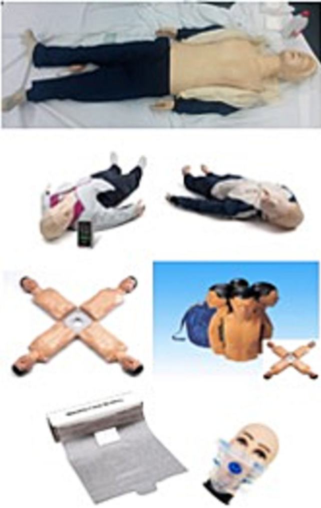
Figura 2 Material utilizado para la formación y la evaluación.

Al comparar los resultados de aquellos alumnos instruidos por el profesor de instituto, versus aquellos instruidos por un sanitario, se apreció que los resultados fueron mejores en el grupo del profesor (79,20 vs. 63,66%, p = 0,001 ). Las diferencias son significativas en cuanto a la activación del servicio de urgencias (90,21 vs. 84,78%, p = 0,036 ) y en cuanto a la maniobra de reabrir la vía aérea y realizar insuflaciones (91,74 vs. 83,54%, p = 0,001 ).