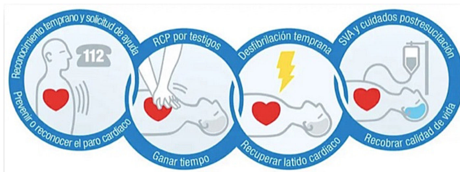
Figura 1 Cadena de Supervivencia (European Resuscitation Council).

Diferentes instituciones han sistematizado estrategias para reducir el exceso de mortalidad, dirigidas a la población en general. Nace así la llamada «Cadena de Supervivencia», que consiste en una sucesión de técnicas dirigidas a tratar la PCR: reconocimiento temprano y solicitud de ayuda, RCP por testigos, desfibrilación temprana, SVA y cuidados posresuscitación (fig. 1). Los primeros eslabones de esta cadena dependen de la formación en RCP de la