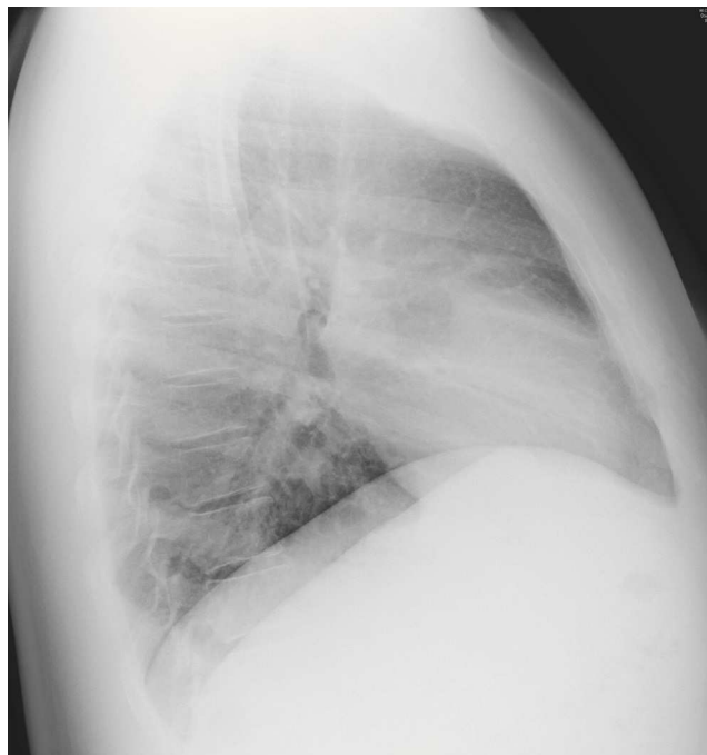
Figura 2 Radiografía lateral de tórax.