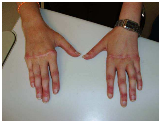
Figura 2. Lupus eritematoso sistémico y artropatía de Jaccoud: corrección quirúrgica.

En casos evolucionados, cuando las deformidades son fijas e irreversibles puede recurrirse a la corrección quirúrgica 68,97 , actuando