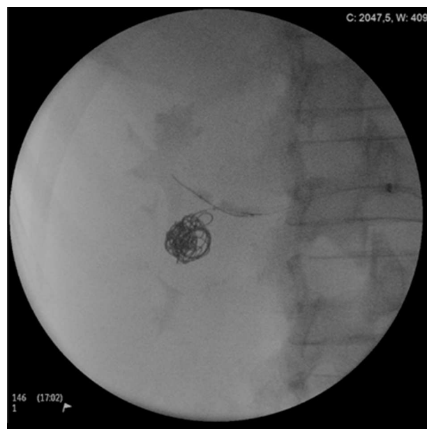
Figura 2 Oclusão com balão do colo do aneurisma, aquando da libertação dos coils.