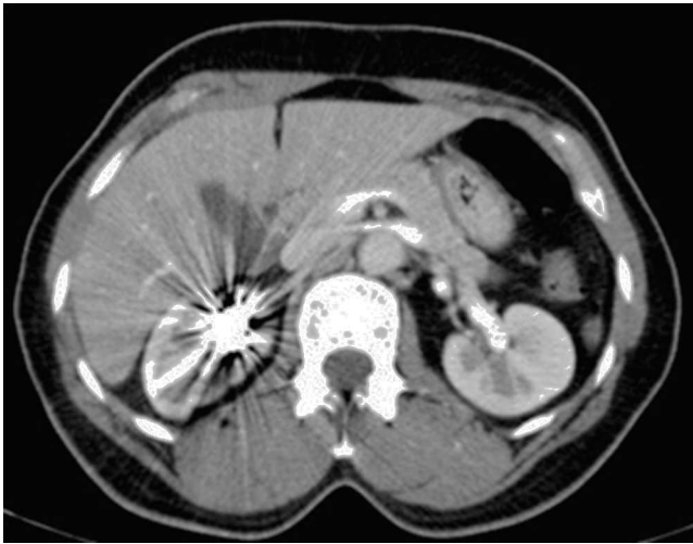
Figura 4 AngioTC de controle, após exclusão do aneurisma, sem evidência de reperfusão.

A etiologia mais frequente do AAR é degenerativa com perda das fibras elásticas e redução do tecido muscular liso da média 3 .