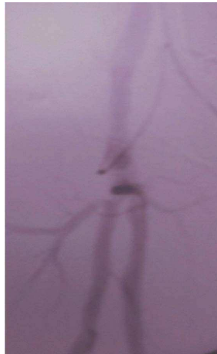
Figura 3 Controle angiográfico intra-operatório.