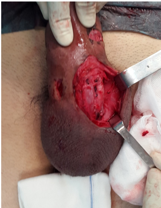
Figura 1 Abordagem dos corpos cavernosos.