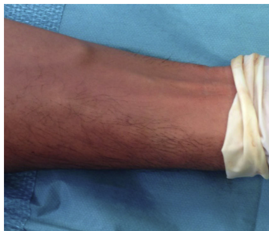
Figura 1 Imagem das veias no pré-operatório.

* Dados do estudo randomizado «Radial versus femoral access for coronary angiography and intervention in patients with acute coronary syndromes» (RIVAL trial 2 ).