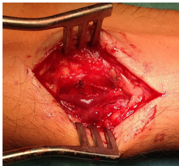
Figura 2 Imagem da fístula intraoperatoriamente.

Sob anestesia local com lidocaína 2%, procedeu-se à exploração do local da punção com identificação de FAV radial (fig. 2). Realizada dissecação de artéria e veia, e laqueação de trajeto fistuloso com Vycril® 3-0, incluindo a veia aferente e eferente, junto ao orifício arterial (fig. 3). Encerramento por planos, sutura intradérmica com Vycril® 4-0. Clinicamente sem frémito após o procedimento e com