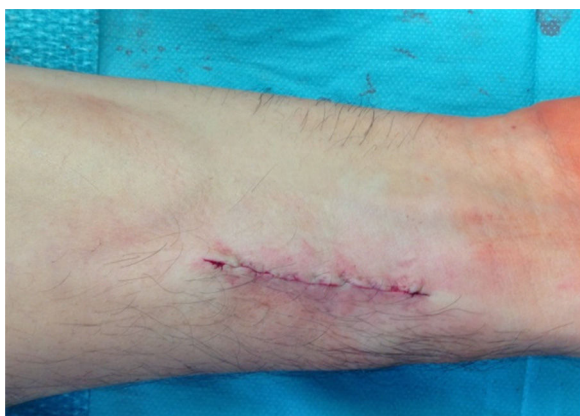
Figura 4 Pós-operatório verificando-se desaparecimento do ingurgitamento venoso.

A maioria dos doentes com FAV radial é assintomática, apresentando-se com massa pulsátil, com frémito ou sopro.