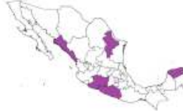
Figura 3 Nivel de avance en las actividades del Componente de Detección y Atención Oportuna en las entidades federativas, realizadas por la Comisión Nacional de Protección Social en Salud (CNPSS) en conjunto con el Centro Nacional para la Salud de la Infancia y la Adolescencia (CeNSIA), el Hospital Infantil de México Federico Gómez (HIMFG) y los Servicios Estatales de Salud.

F. Centros regionales de desarrollo Infantil y estimulación temprana en operación en cinco entidades