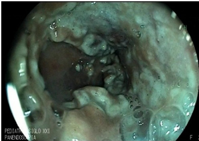
Figura 2 Aplicación del Hemospray® en el sitio del sangrado.

hacia una terapia definitiva, debido a que no requiere mayor destreza endoscópica. Existen reportes de población adulta con sangrado masivo variceal y no variceal refractario al tratamiento convencional tratados exitosamente con Hemospray® sin eventos adversos 11,12 . En este caso, el Hemospray® demostró ser efectivo y seguro.