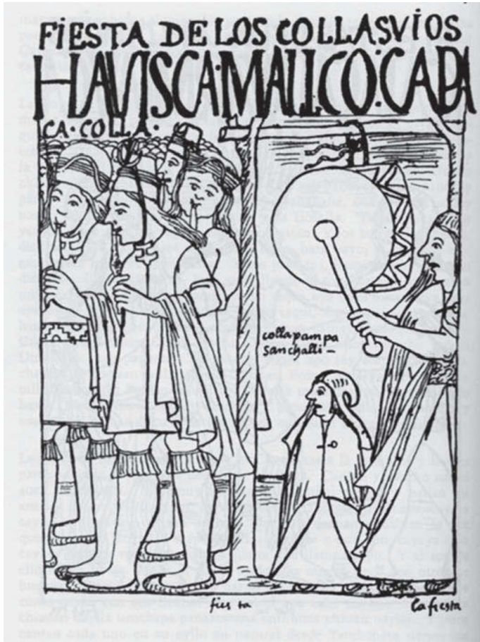
Lámina núm. 2. Fiesta de los Collasuyus. (Poma de Ayala, 2005, folio 324).