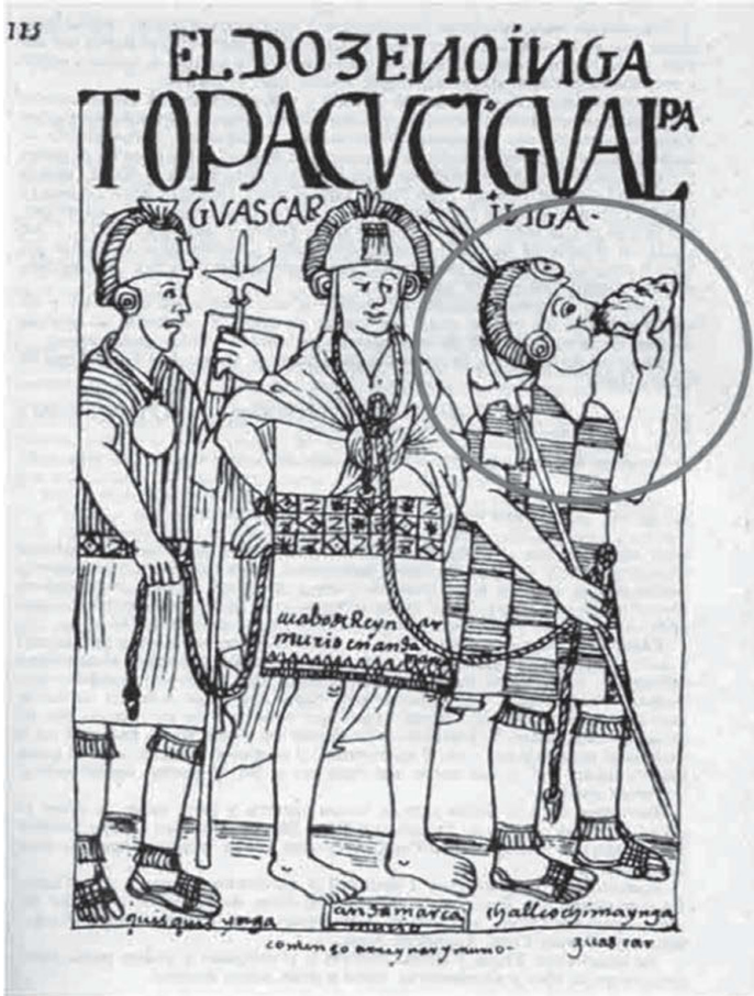
Lámina núm 1. El doceno Inga Topa Cusi Gualpa Guáscar Inga-acabó de reinar, murió en Andamarca-quisquis Inga, Andamaraca, Chalcochima-començo a reinar y murió. (Poma de Ayala, 2005, folio 115).