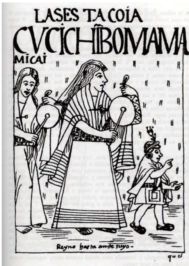
Lámina núm. 3. La sexta Coya Cusi Chimbo Mama Mícai. (Poma de Ayala, 2005, folio 130).