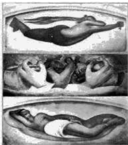
Imagen 2. Futuro , núm. 4, enero, 1934, p. 30.

O paratextos que también son performativos en tanto que discursivamente intervienen en el presente y tienen la intención de modificarlo, como por ejemplo el epígrafe que acompaña a la imagen de la revista Futuro :