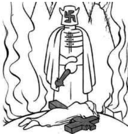
Imagen 3. Guerrero, X. “Paz con paz, guerra con guerra”, en Futuro , núm 44, octubre, 1939, p. 16.

encarnado en un sacerdote que, desde el infierno y cubierto con una máscara que tiene una esvástica, condena a los inocentes en nombre del catolicismo. Las imágenes performativas y el discurso cargado de imágenes sensoriales contribuyen en la creación (poiesis) de una atmósfera terrible.