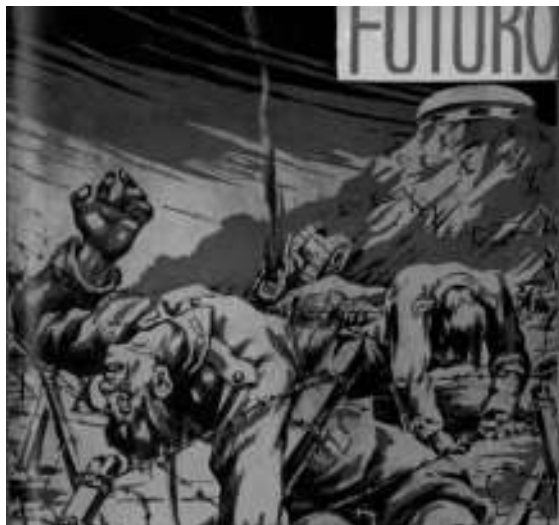
Imagen 5. Portada en Futuro , núm. 44, octubre, 1939