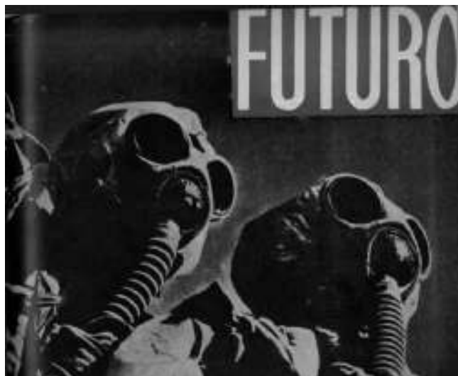
Imagen 4. Portada en Futuro , núm. 42, agosto, 1939.

Medio millón de antifascistas españoles —en números redondos— logró escapar a la barbarie franquista, refugiándose en el Extranjero, ora través de la frontera pirenaica, ora partiendo de los puertos mediterráneos leales, rumbo a Francia o al N. de África. ¿Cuál ha sido la suerte de estos desventurados, cuyo único delito fue defender la independencia de su patria, al tiempo que luchaban por la libertad del mundo? 52