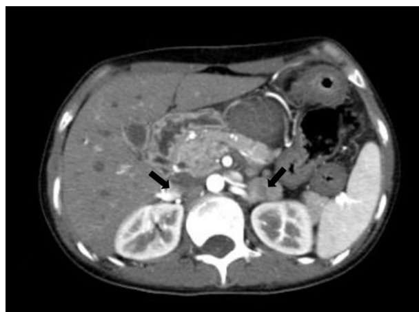
Figura 3 Tomografía espiral multicorte (TEM), que muestra la presencia de masas en ambas glándulas suprarrenales, compatibles con feocromocitoma bilateral.