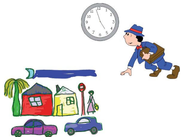
Figura 2. Urbanización: reducción de los espacios para el juego y para el deporte.

— La urbanización excesiva, que afecta especialmente a los grupos sociales de menores ingresos y supone la reducción de los espacios para el juego infantil y para el deporte, con el peligro asociado de un tráfico agobiante (fig. 2).