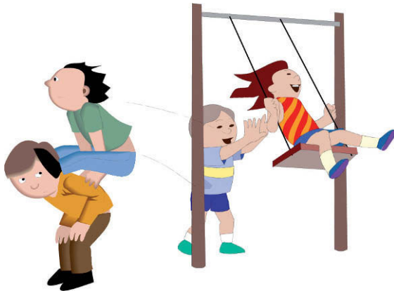
Figura 4. Miedo al peligro de la calle y parques: violencia, coches... Escasez o lejanía de áreas deportivas o de ocio.

y asociaciones de vecinos, para proveer de actividades lúdicas (deportes, baile, juegos de grupo) hasta media tarde a los niños cuya jornada escolar no es compatible con la dedicación laboral de sus padres.