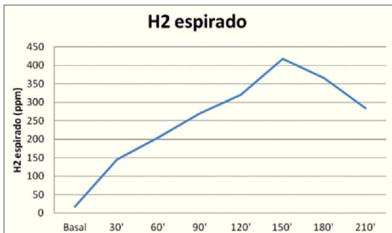
Figura 1. Prueba de H 2 espirado tras sobrecarga con glucosa en un paciente con malabsorción congénita de glucosa-galactosa.

Déficit madurativo de lactasa. La lactasa es deficiente hasta la 34. a semana de gestación. Los lactantes pretérmino pueden beneficiarse del uso de fórmulas suplementadas con lactasa o reducidas en lactosa 21 , pero, con frecuencia, la leche de mujer no tiene efectos perjudiciales a corto y largo plazo. En el neonato, más de un 20% de la lactosa ingerida puede alcanzar el colon, produciendo un pH fecal ácido (5-5,5) y favoreciendo el desarrollo de ciertas especies bacterianas ( Bifidobacterium y Lactobacillus ).