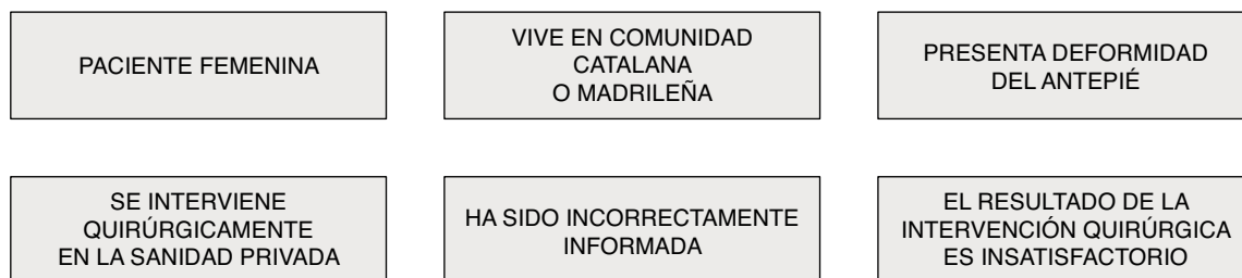
Figura 1 Prototipo de caso proclive a una reclamación por mala praxis.

A la hora de interpretar este perfil debemos tener en cuenta que la mayor parte de los pacientes en una consulta de cirugía del pie suelen ser mujeres y que la Comunidad autónoma madrileña y la catalana son dos de las más pobladas en nuestro país.