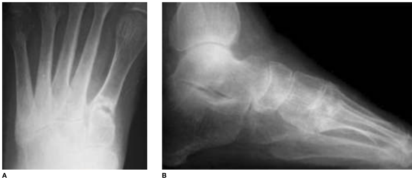
Figura 6 A) Radiografía dorsoplantar: imagen de coalición de la lesión, con densificación y esclerosis. Se observan cavidades, sin clara imagen de secuestros. B) La radiografía de perfil muestra conservación de la morfología del pie, sin colapso del arco y mejoría de la osteopenia.

El caso clínico que se expone es un ejemplo de error diagnóstico inicial, interpretándose como una simple lesión fracturaria. Afortunadamente, el error se subsanó y se aplicó el tratamiento adecuado de modo que el paciente evolucionó satisfactoriamente.