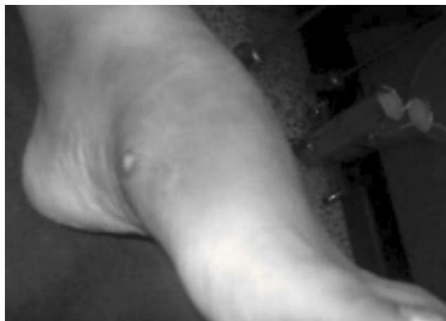
Figura 4 Fístula en cara medial del pie con drenaje de material blanquecino espeso.

teriológico (cultivo para gérmenes específicos, inespecíficos y hongos), siendo los resultados negativos para gérmenes inespecíficos y positivo para Mycobacterium tuberculosis . La histopatología mostró necrosis fibrinoide, células histiocíticas en empalizada, células multinucleadas y proceso granulomatoso necrotizante compatible con granuloma tuberculoide. Frente a este resultado se inició tratamiento antibiótico específico con cuádruple plan en base a isoniacida, rifampicina, piracinamida y etambutol por dos meses, continuando con los primeros dos fármacos por 10 meses más.