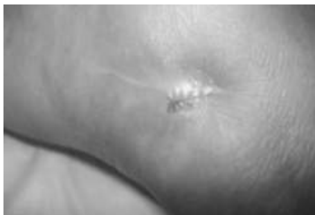
Figura 5 Cara medial del pie izquierdo. Herida cerrada a los 2 meses de iniciado el tratamiento.

La TBC en el pie no siempre se manifiesta de la forma típica con la que lo hace en otras localizaciones óseas, por lo que en muchas ocasiones, se confunde inicialmente con otras afecciones osteoarticulares. Este retraso diagnóstico lleva a que el tratamiento se inicie tardíamente, con riesgo de que la lesión se extienda a la articulación vecina, la destrucción sea mayor y las posibles secuelas más invalidantes.