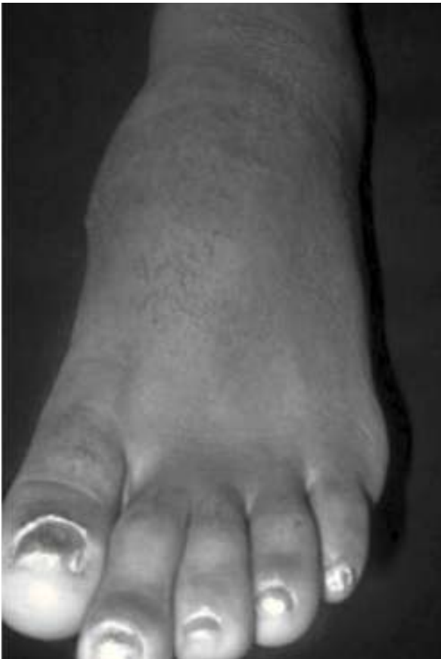
Figura 1 Deformidad en región dorso-medial del pie izquierdo, a nivel de primera articulación cuneometatarsiana.

El tratamiento consistió, inicialmente, en la cura quirúrgica de la zona fistulizada drenándose material blanquecino de aspecto caseoso; se efectuó el estudio histopatológico y bac-