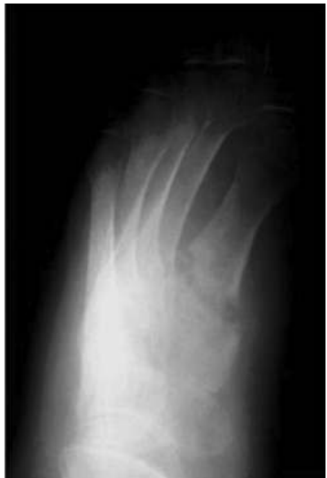
Figura 2 En la radiografía se observa la alteración estructural entre la primera cuña y el primer metatarsiano.