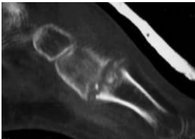
Figura 3 La TC muestra en su corte sagital la evidente alteración estructural de la base de primer metatarsiano con extensión a la articulación con la primera cuña.