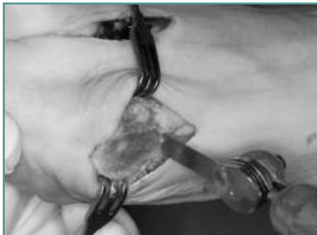
Figura 6. Osteotomía subcapital.

Tras la osteotomía, utilizamos un iniciador para posicionar la placa en el canal intramedular del primer metatarsiano (Figuras 7 y 8). La placa que hemos elegido se coloca montada en una guía que dirige el brocado desde fuera, para atravesar los orificios intramedulares, como en un clavo trocantérico de cadera. Una vez posicionada hasta el fondo la placa, realizamos el orificio más distal de los proximales, con la broca de 2 mm (Figura 9). Realizamos el avellanado