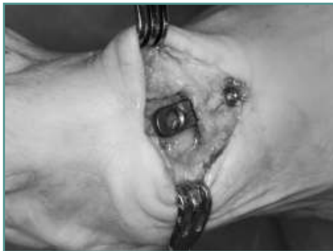
Figura 12. Guía retirada.