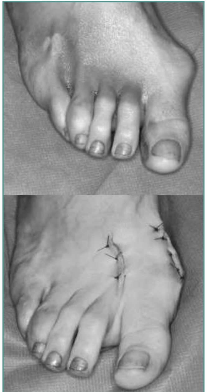
Figura 17. Foto clínica antes y después de la cirugía. Figure 17. Clinical picture before and after surgery.

Puede ser muy útil en casos de osteopenia, diáfisis estrechas y recidivas de otras técnicas.