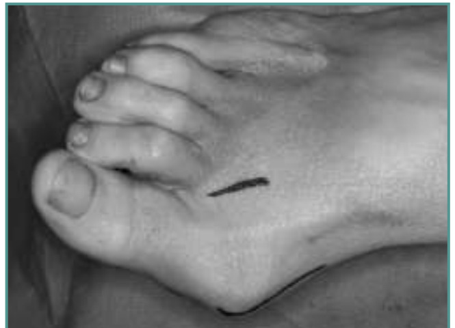
Figura 3. Abordajes quirúrgicos.

Figure 2. Small plate with the introductory guide.