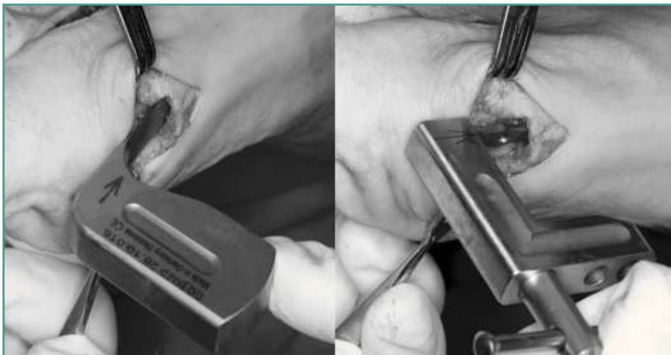
Figuras 7 y 8. Iniciador para la placa e introducción de la misma en el canal del metatarsiano.

Figures 7 and 8. Plate initiator and plate intramedular introduction in the metatarsal.