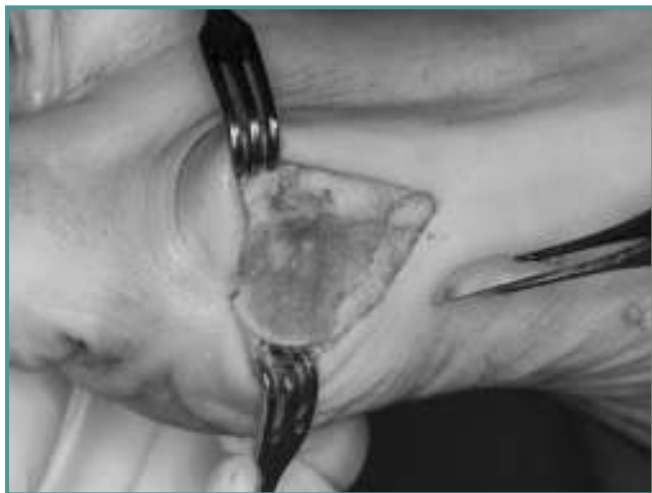
Figura 4 Bunionectomía.