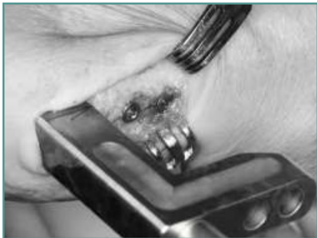
Figura 11. Tornillos proximales.