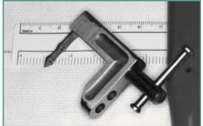
Figura 2. Placa pequeña con la guía de introducción.

Figure 2. Small plate with the introductory guide.