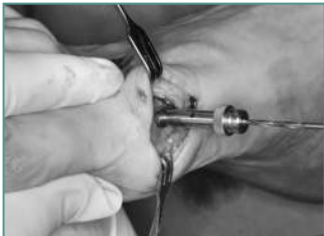
Figura 13. Brocado distal.