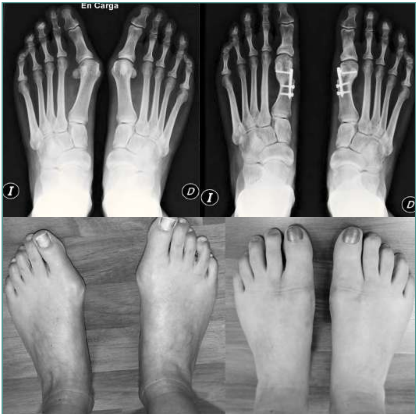
Figuras 18, 19, 20 y 21. Hallux valgus bilateral tratado con placa V-Tek®. Control radiográfico y visual.

Figures 18, 19, 20 and 21. Bilateral hallux valgus treated with V-Tek® plates. Radiographic and visual controls.