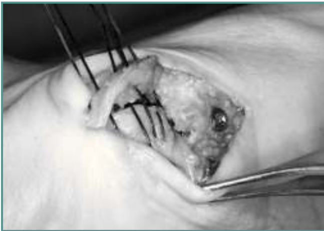
Figura 16. Capsulorrafia medial. Figure 16. Medial capsulorrhaphy.

gir el ángulo distal articular (DASA), pronación del dedo o acortar el dedo. Este gesto lo realizamos habitualmente de forma percutánea (Akin MIS) (6) .