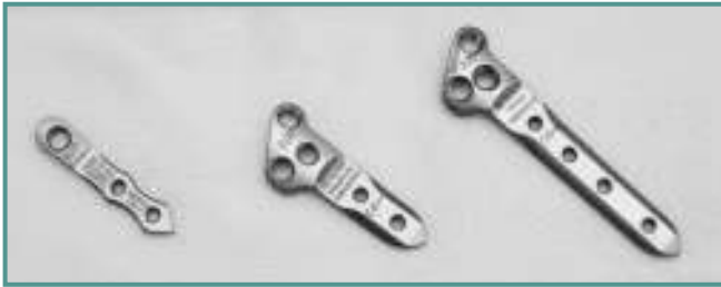
Figura 1. Las tres placas V-Tek®.

Figure 1. Three different designs of V-Tek® plates.