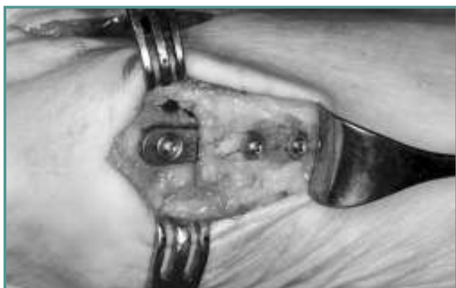
Figura 15. Resultado final con la placa implantada.

Figure 15. Final result with the implanted plate.