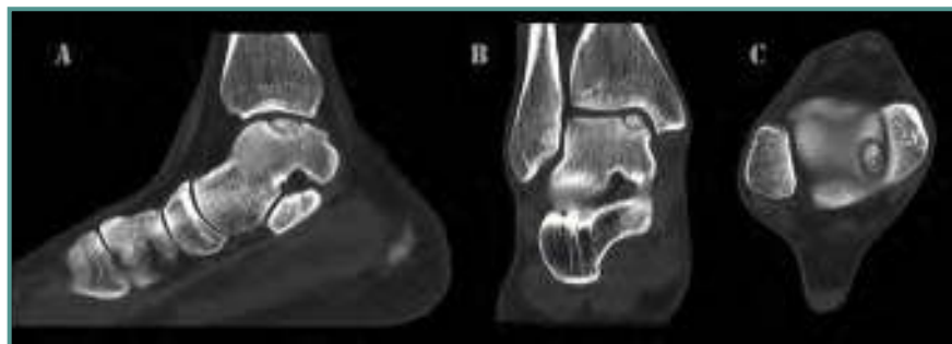
Figura 2. TC que muestra una lesión osteocondral de la cúpula astragalina de grado III de Ferkel.

Figure 2. CT showing an osteochondral lesion of the talar dome Ferkel grade III.