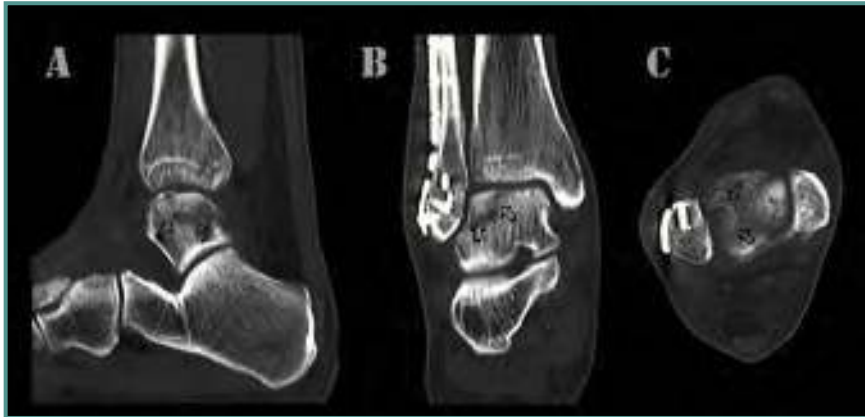
Figura 4. TC de control postoperatorio a las 7 semanas en el que se muestra el inicio de la osteointegración del injerto. A: corte sagital; B: corte coronal; C: corte axial.

Figure 4. 7 weeks postoperative CT scan control showing the graft osseointegration beginning. A: sagittal section; B: coronal section; C: axial section.