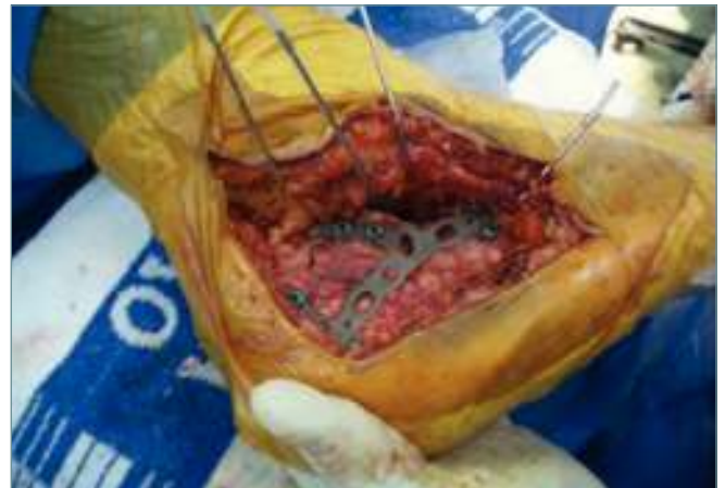
Figura 5. Osteosíntesis definitiva con placa específica con colocación de 6 tornillos. Se visualiza correctamente la reducción de la fractura.

La síntesis estable nos permitirá una movilización precoz, procurando mantener la extremidad elevada la primera semana si la herida tiene buen aspecto y no hay