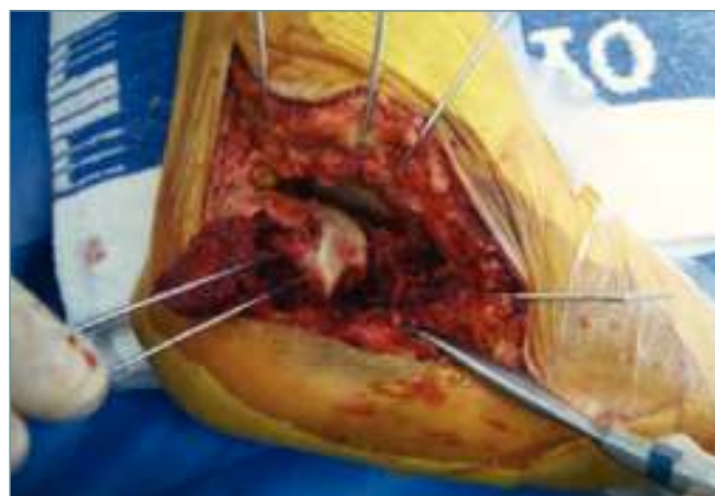
Figura 3. Síntesis provisional de los fragmentos lateral y central y reducción con ayuda del elevador hacia el fragmento medial.

Seguidamente debemos proceder al restablecimiento del ángulo de Gissane. En la parte anterior, el margen inferior del la carilla del ángulo de Gissane debe estar alineado con el calcáneo intacto. En el caso de que el fragmento anterolateral esté desplazado, debe reducirse y fijarse provisionalmente mediante AK. Aprovechamos para comprobar la congruencia articular a nivel de la carilla calcaneocuboidea y, si es necesaria la reducción y síntesis provisional, con AK (Figura 4).