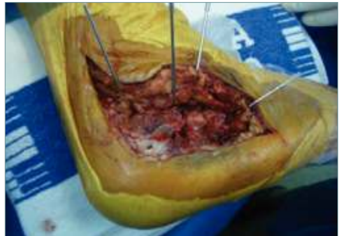
Figura 1. Vía de abordaje con elevación del colgajo sin disección de planos que incluyen la piel, el tejido subcutáneo, los tendones peroneos y el nervio sural; exposición del calcáneo y situación de 4 agujas de Kirschner a modo de separador para minimizar las tracciones sobre el colgajo.

Desimpactaremos los fragmentos articulares y los movilizaremos cuidadosamente ayudados de un elevador o periostotomo, e iniciaremos la reducción intentando corregir la altu-