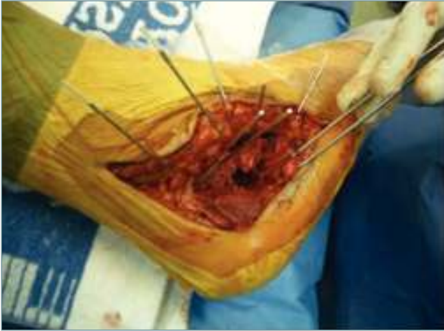
Figura 4. Síntesis provisional de los fragmentos con agujas de Kirschner. Obsérvase el defecto de sustancia ósea que queda por debajo de los fragmentos articulares reducidos.

Figure 4. Provisional synthesis of the fragments with Kirschner wire needles. Observe the bone defect below the reduced articular fragments.