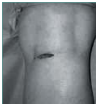
Figura 4. Herida quirúrgica. Figure 4. Surgical incision.

Figure 3. A line is drawn on the flexion cutaneous pleat of the knee. A: knee in full extension. B: knee with some degrees of flexion.