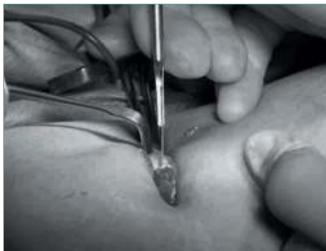
Figura 8. Las fibras blancas seccionadas con bisturí sobre el disector.

Figure 7. The medial head of the gastrocnemius is exposed.