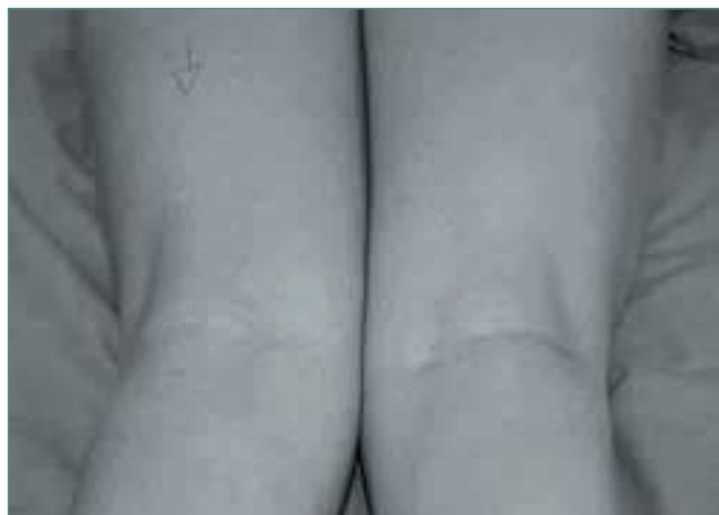
Figura 1. Cicatriz estética en pierna derecha en paciente pendiente de intervenir de miembro inferior izquierdo.

Figure 1. Esthetic scar on the right leg in a patient that is waiting for surgery of the left leg.