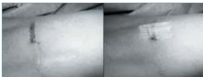
Figura 10. Sutura de herida quirúrgica.

Una vez completada la sección de todas las fibras, se comprueba el aumento de la flexión dorsal del tobillo con la rodilla en extensión. Se retira el disector, se lava la herida quirúrgica con suero y se realiza hemostasia cuidadosa de los puntos sangrantes. Se sutura el tejido celular subcutáneo con Vicryl® de 2-0 y la piel con una sutura continua intradérmica o “en U” con Vicryl rapid® de 2-0 (Figura 10). Finalmente, se cubre la herida quirúrgica con un apósito (Figura 11).