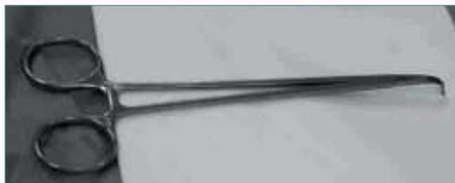
Figura 6. Disector (modelo O'shaughnessy 150 mm; BJ 120 Aesculap®).

( Figura 7 ). En este momento es fundamental distinguir entre fibras aponeuróticas (de color blanco) y musculares (de color rojo) y se seccionan con una hoja de bisturí sobre el disector tan sólo las fibras aponeuróticas ( Figuras 8 y 9 ).