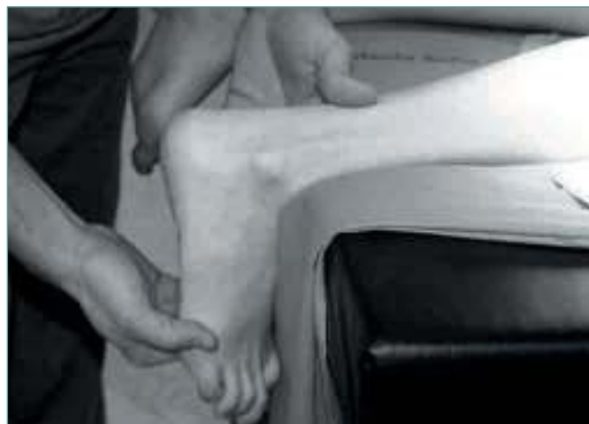
Figura 2. Colocación de paciente en decúbito prono en la mesa de quirófano.

Tras la incisión en piel, se realiza una disección superficial del tejido celular subcutáneo, se abre la fascia superficial y se identifica la cabeza del gemelo medial ( Figura 4 ). Se pasa el dedo índice en profundidad, entre la cabeza del gemelo medial y la tibia. Para asegurarse de que no se incluye con el dedo otra estructura próxima (principalmente, el tendón del semimembranoso), mientras se palpa la cabeza del gemelo medial se realiza flexoextensión del tobillo, para comprobar la tensión del músculo ( Figura 5 ). Una vez confirmada la localización de la cabeza del gemelo medial, se pasa un disector ( Figura 6 ) entre la cabeza del gemelo medial y la tibia y se expone la cabeza del gemelo medial por fuera de la piel