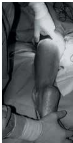
Figura 5. Identificación de gemelo medial.

Figure 5. The medial head of the gastrocnemius is identified.