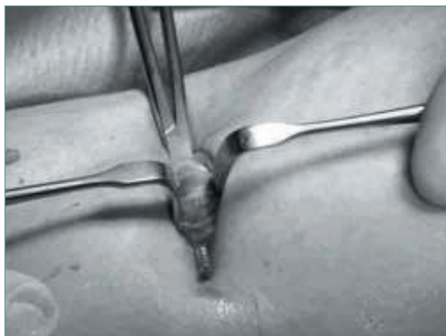
Figura 7. Exposición de gemelo medial.

Figure 6. Dissecting forceps (model O'shaughnessy 150 mm; BJ 120 Aesculap®).