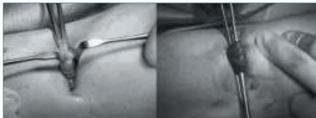
Figura 9. La cabeza del gemelo medial antes y después de la sección de la aponeurosis (fibras blancas).

Figure 9. The medial head of the gastrocnemius before and after the aponeurosis section (white fibers).