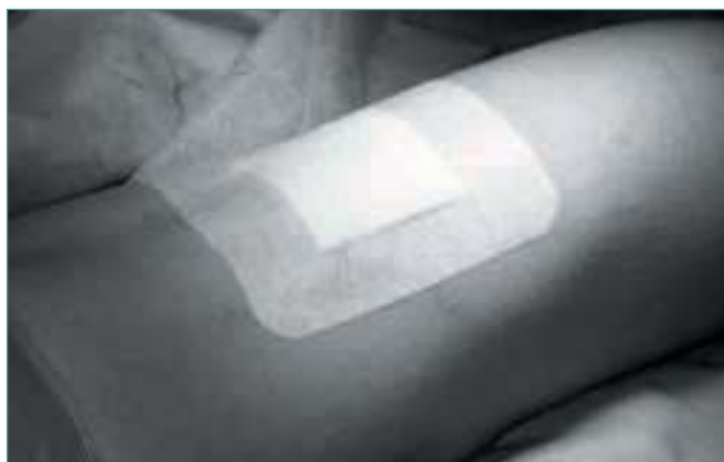
Figura 11. Herida cubierta por apósito.

Figure 10. Surgical wound after being sutured.