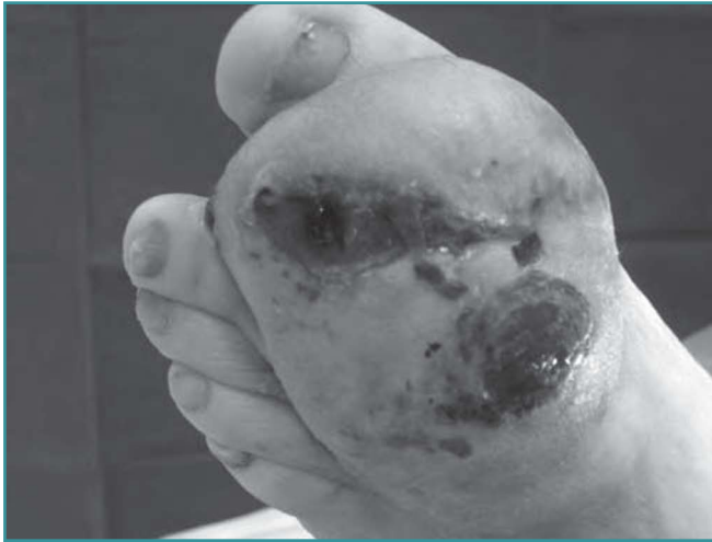
Figura 1. Tumoración de gran tamaño en el dorso del pie. Figure 1. Large tumoural mass on the dorsal aspect of the forefoot.

dolorosa en el espacio entre cuarto y quinto metatarsianos del pie derecho. Con el diagnóstico de neuroma de Morton, se le realizó una resección marginal. Acudió a nuestra consulta con dolor y empastamiento en dorso y planta del pie. La biopsia fue informada carcinoma epidermoide verrucoso bien diferenciado.