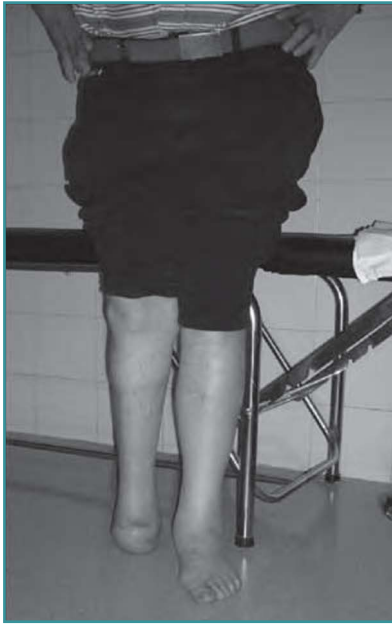
Figura 5. Deambulación domiciliaria sin prótesis.

Figure 5. At-home ambulation without prosthesis.