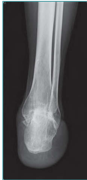
Figura 4. Radiográfico al año. Figure 4. X-ray control one year after surgery.

tió la carga parcial de peso, hasta entonces impedida por los clavos. A los 3 meses se le autorizó la carga total del peso.