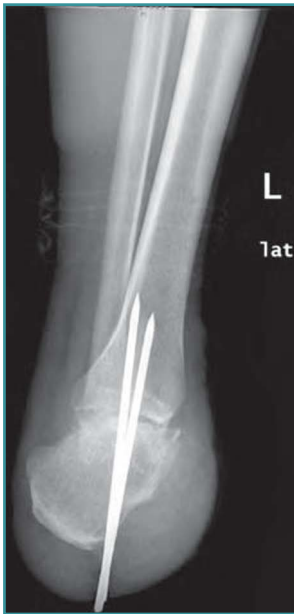
Figura 3. Radiografía postoperatoria. Figure 3. Postoperative X-ray image.