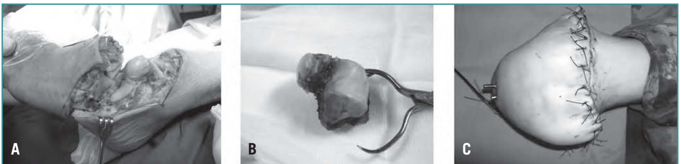
Figura 2. A: imagen intraoperatoria que muestra la incisión y exposición ósea; B: extirpación del astrágalo; C: resultado postoperatorio. Figure 2. (A) intraoperative image showing the surgical incision and the bone exposure; (B) excision of the talus; (C) postoperative results.

Se realizaron un seguimiento clínico y radiográfico. Cuando se observó callo óseo, se retiraron los clavos de Steinmann, que sucedió a las 6 semanas, consiguiéndose la artrodesis ( Figura 4 ). En el momento de retirar los Steinmann, se permi-