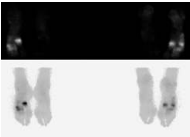
Figura 2 Primera gammagrafía (día 30).

altas a nivel de los metatarsianos y en la tibia. Generalmente, asientan a nivel diafisario, aunque cuando afectan al primer o quinto metatarso las fracturas de estrés suelen ser más proximales. El metatarso más afectado es el segundo, seguido de cerca del tercero. El cuarto se afecta con menos frecuencia. Las fracturas de estrés del primer metatarso son raras, aunque en población joven su frecuencia es mayor 10-12 .