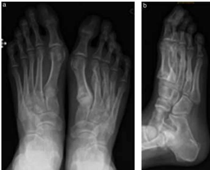
Figura 1 Radiografías iniciales (día 1).