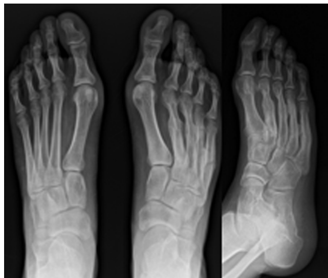
Figura 6 Radiografías finales (14 meses).

Este caso clínico describe la aparición de hasta 7 fracturas de estrés en un paciente joven, sano, sin alteraciones metabólicas ni condicionantes laborales que justifiquen una