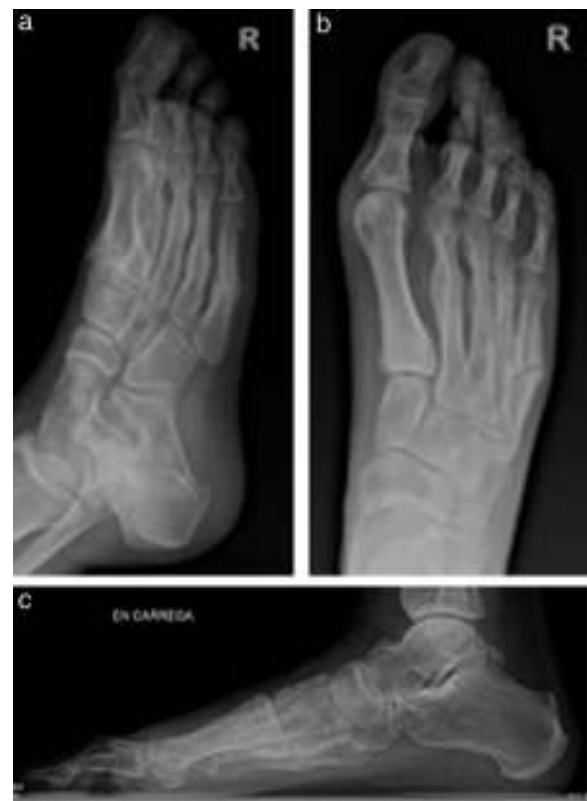
Figura 3 Radiografías con todos los metatarsianos fracturados (3 meses).

Se ha visto que la incidencia de las fracturas de estrés se ve condicionada por factores intrínsecos como determinados dismorfismos anatómicos (pies cavos con retropié varo, index minus, pie pronado, disimetrías, anteversión femoral) o patologías metabólicas; también por factores extrínsecos,