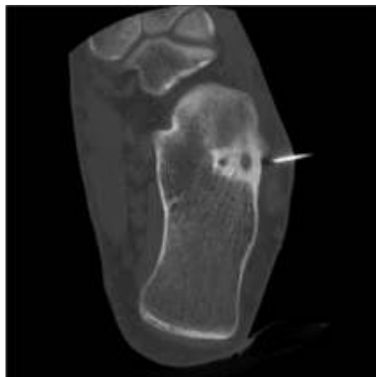
Figura 4 Imagen coronal de TC donde se observa el osteoma osteoide a nivel del calcáneo al realizar la RF.

En la RMN se aprecia una alteración de la señal de morfología reticular que afecta a la mitad anterior de la porción lateral del calcáneo y que se comporta como hipointensa en T1 e hiperintensa en T2, compatible con edema óseo. Se observa edema de los tejidos adyacentes en la cara lateral del tobillo a nivel inframaleolar con extensión hacia la porción externa del seno del tarso y leve derrame articular (fig. 2).