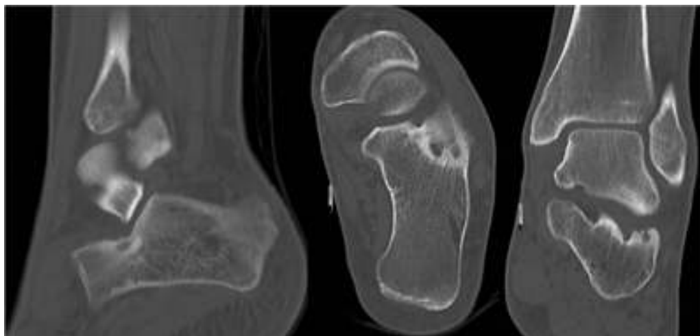
Figura 3 Corte sagital y coronal de TC donde se observa osteoma osteoide en el calcáneo.

Debido a la localización de la lesión y al tipo de tumoración ósea benigna, se opta por tratamiento con ablación por RF guiada por TC: se realiza punción del OO en calcáneo izquierdo guiada por TC con aguja de 7 mm de punta activa. La ablación térmica se realiza en 2 ciclos consecutivos. En primer lugar, automáticamente con la energía de impedancia controlada, durante 7 min se calienta la lesión hasta una temperatura de 60°C con enfriamiento por agua y después, manualmente, otros 5 min hasta 90°C sin enfriamiento por agua. No se producen complicaciones durante el procedimiento (figs. 4 y 5). El paciente no precisó ingreso hospitalario y fue dado de alta a las 2 h del tratamiento.