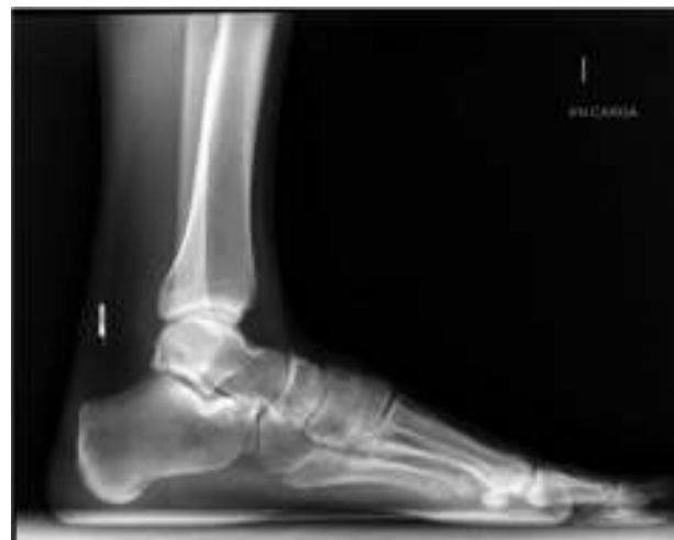
Figura 1 Radiografía lateral de tobillo y pie sin alteraciones.

Puesto que las pruebas de imagen iniciales no objetivan lesiones, se decide, en consulta, realizar infiltración con anestésico local a nivel del seno del tarso. Tras la espera