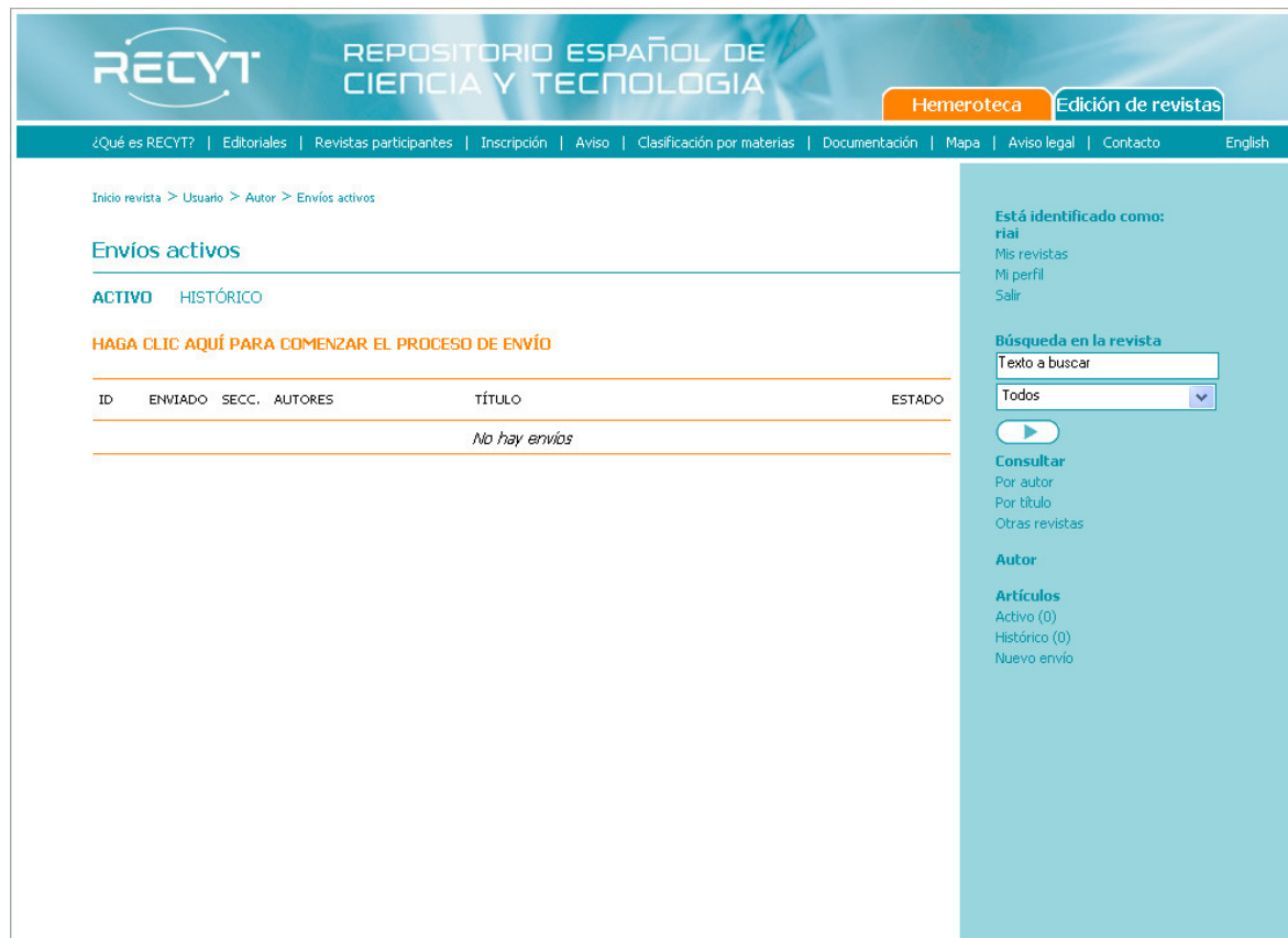
Figura 3. Página de inicio de los envíos

Tras cumplir con la etapa de identificación, podemos pasar a realizar los envíos a través de la página inicial del autor.