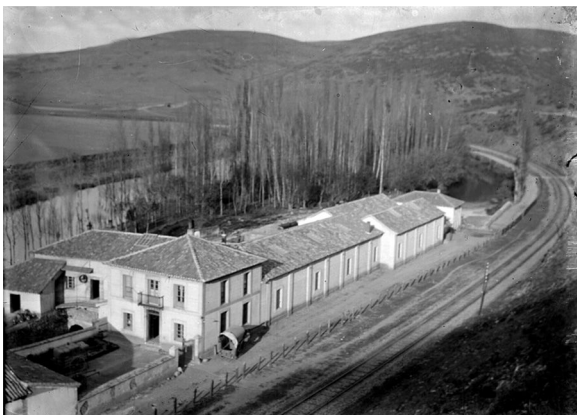
Figura 3. El complejo harinero El campo de Alar del Rey en torno a 1870.

Volviendo a los aspectos gerenciales, un maestro dirigía las fábricas, las más de las veces, ubicadas en núcleos rurales. Junto a las harineras se alzaban las viviendas de los trabajadores cualificados a sueldo, conformando pequeñas colonias industriales (véanse las figuras 2 y 3), en antiguos cotos redondos, despoblados de conventos y monasterios. La observancia de la más estricta moralidad y disciplina guiaba las relaciones laborales. El perfeccionamiento técnico de las harineras, capital-intensivas, llegó a tal punto que la