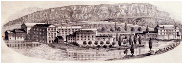
Figura 2. La colonia industrial La horadada en Mave (Palencia) en torno a 1880.

que la empresa se dividía entre tantas porciones como herederos. Es decir, no inquietaba la continuidad de una institución de cuya existencia y pertenencia no tenían los harineros conciencia en cuanto tal, sino del patrimonio de la familia. Había que mantener los bienes, el prestigio, el honor y los contactos de sus miembros, no de la empresa. De hecho, a lo largo de su carrera mercantil, el harinero podía acordar múltiples alianzas societarias (incluso en compañías accidentales para un envío concreto de harinas) según lo aconsejase el mercado, el cambio técnico o la legislación arancelaria con una duración más o menos efímera. La familia siempre estaba ahí, ajena a estas eventualidades.