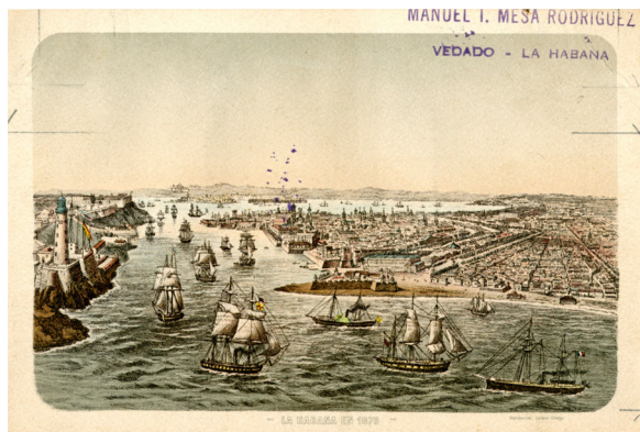
Figura 5. La bahía de La Habana en 1870.

Las condiciones de embarque y expedición de este producto a ultramar no se diferenciaron mucho de las empleadas en su trasego entre Valladolid a Santander. Habitualmente, un miembro de la familia del armador radicado en La Habana se hacía cargo de la recepción de las harinas (fig. 5). De no ser así, contrataba la venta con compañías habaneras especializadas ( Pastor y Cía. e Hijos de Odriozola ) o se le otorgaban plenos poderes al capitán a tal efecto.