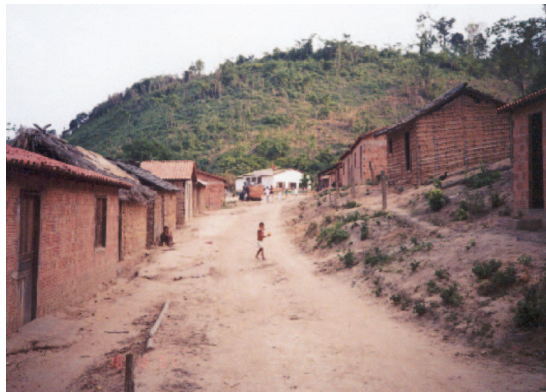
Figure 2 - Typical image of rural Buriticupu. Figura 2 - Imagem típica encontrada nas áreas rurais.

Students participating in the Bandeira Científica project are invariably challenged to cope with some of the difficulties inherent to these poor communities; upon returning home to São Paulo, a new set of concepts occupies their minds. As in other occasions, this issue of the Bandeira