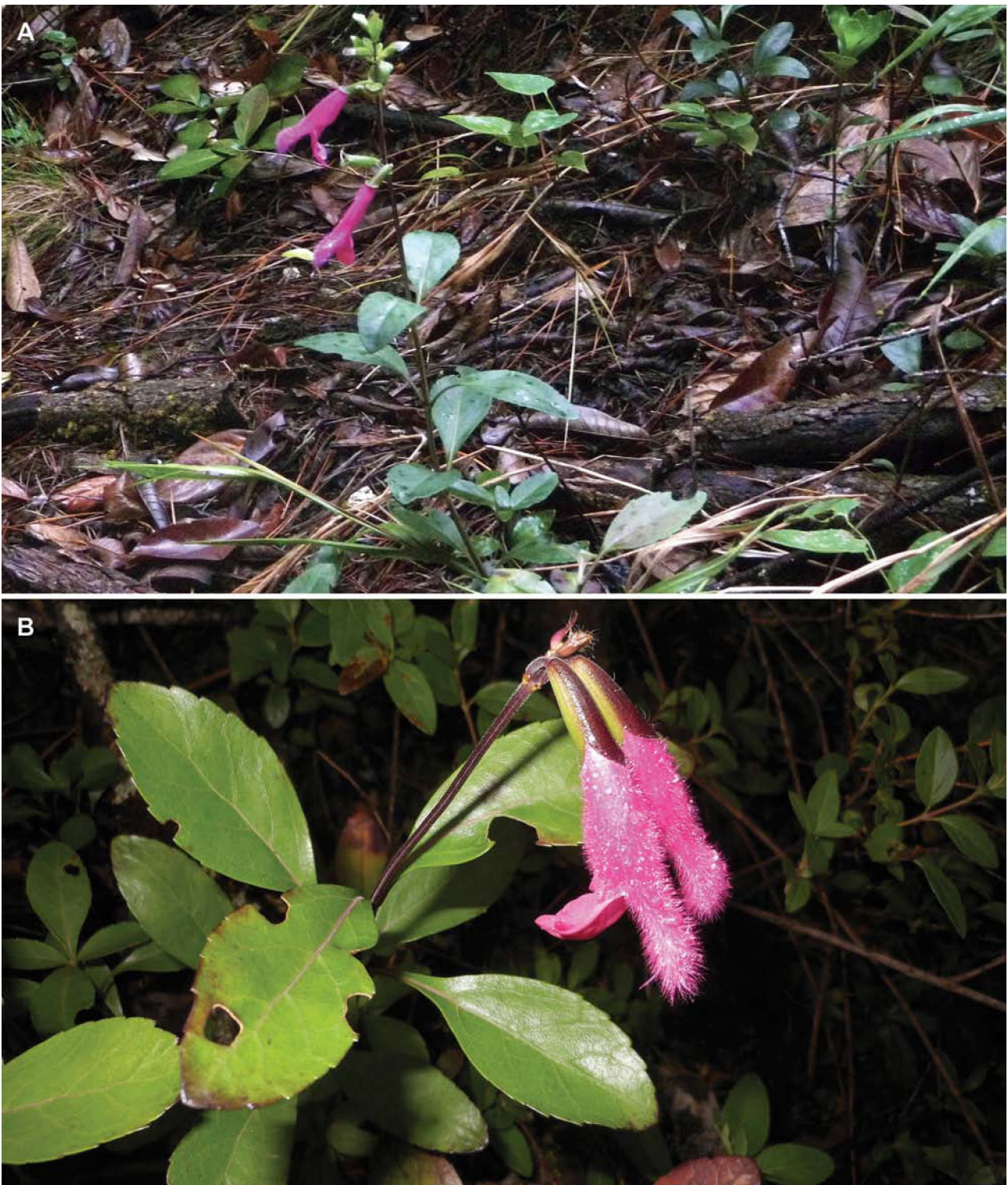
Figura 3. A, planta de Salvia buchananii en su ambiente natural, en un bosque de Pinus greggii y B, acercamiento a las flores de S. buchananii .