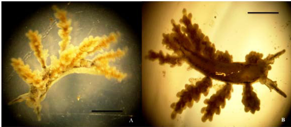
Figura 1. Doto chica . A, vista dorsal; B, vista ventral. Escala= 1mm.