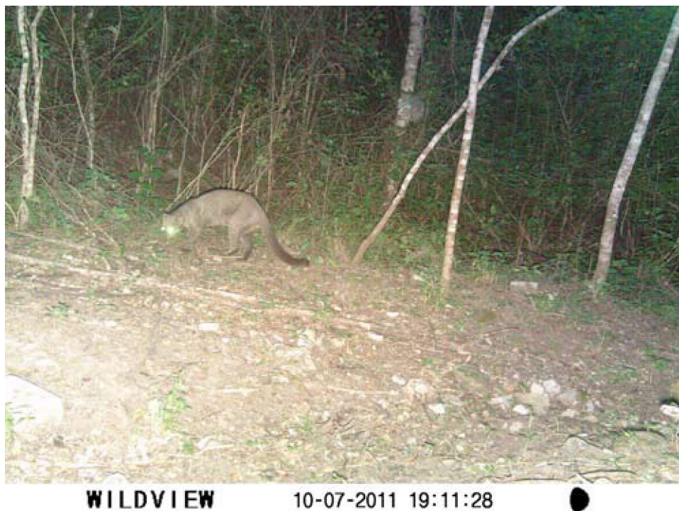
Figura 2. Fotografía de Puma yagouaroundi , tomada en la localidad de San José del Chilar, municipio de Cuicatlán, Oaxaca.

Adicionalmente, se han realizado 3 avistamientos de la especie en la cañada oaxaqueña: el primero de ellos se remonta al 25 de septiembre de 2007, cerca de la población