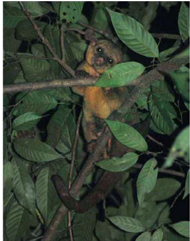
Figura 2. Individuo macho de Potos flavus observado alimentándose en Diospyros digyna en la localidad de El Naranjal, Arteaga.

Las distancias entre los 2 registros de martucha para Michoacán (San José de Los Pinos y El Naranjal), son los que están confirmados más cercanos al sur y pertenecen al municipio de Acapulco, Guerrero, a 335 y 370 km, respectivamente (Ávila-Nájera, 2006) (Fig. 1). Estos registros ayudan a delimitar con mayor precisión sus límites de distribución observada para México y el Pacífico (Fig. 1). En caso de existir una población residente de