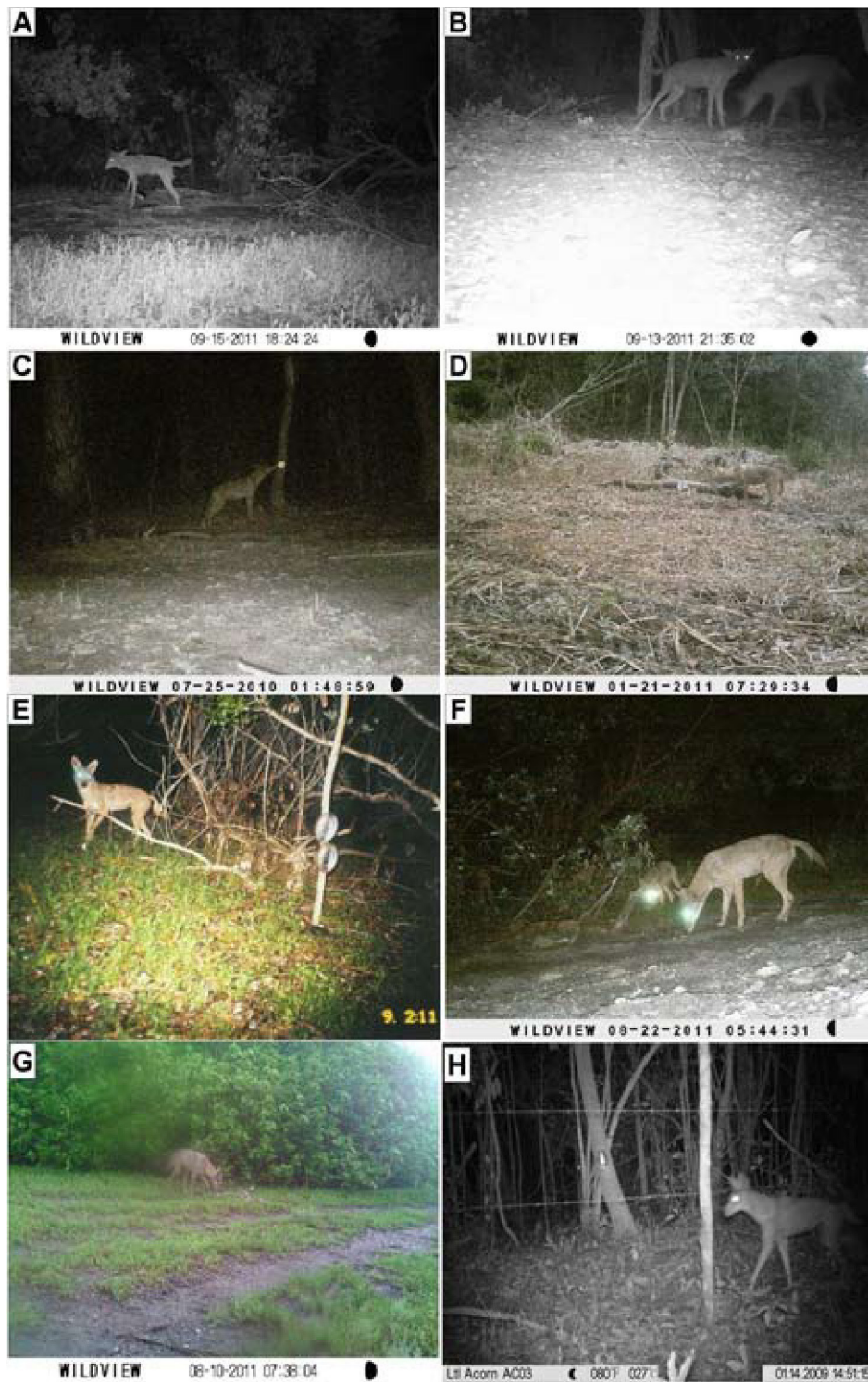
Figura 2. Fotografías de algunos de los coyotes registrados en el oeste de Campeche entre 2009 y 2012. A, coyote solitario en Atasta, Campeche; B, fotografía de pareja de coyotes al parecer adultos en Atasta, Campeche; C, coyote solitario en los alrededores del arroyo Las Piñas; D, coyote solitario fotografiado en la región del Río del Este; E, coyote solitario fotografiado en el ejido Manantiales; F, dos coyotes (al parecer adulto y cría) fotografiados en la región de Sabancuy; G, coyote solitario fotografiado en la región de Sabancuy; H, coyote solitario fotografiado en acahuales del ejido San Pablo Pixtún.