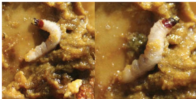
Figura 2. Larvas de Cactophagus spinolae forrajeando en ramas de Stenocereus .