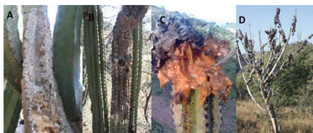
Figura 3. Daño ocasionado por larvas de Cactophagus spinolae . Ramas dañadas de Stenocereus pruinosus (A); S. stellatus (B); aspecto del interior de una rama dañada de S. stellatus (C); individuo muerto (D).

pertenecientes a 2 regiones: valle de Tehuacán: Santiago Miahuatlán, Ajalpán y Coxcatlán; y Mixteca Baja: San Pedro y San Pablo Tequixtepec, Acatlán de Osorio y Cosoltepec. Se contó el total de ramas por individuo y el número de ramas afectadas para establecer el porcentaje de daño, que fue comparado entre especies y regiones mediante un Anova. Stenocereus stellatus ( 4.81 \pm 0.8\% , N = 179 ) presenta significativamente mayor daño que S. pruinosus ( 2.01 \pm 0.9\% , N = 168 ) ( p > F = 0.012 ). El daño es significativamente mayor en el valle de Tehuacán ( 4.89 \pm 0.9\% , N = 174 ) que en la Mixteca baja ( 2.01 \pm 0.9\% , N = 173 ) ( p > F = 0.009 ). Aunque la incidencia del daño no es muy elevada, la infestación causada por las larvas tiene el potencial de afectar a la rama principal, poniendo en riesgo la supervivencia de la planta (Bravo-Avilé, obs. pers.). Si bien, la mayor frecuencia de ramas dañadas se asocia a la presencia de este coleóptero, no se descarta que larvas de otros insectos como lepidópteros Scytodidae y dípteros Sirphidae (A. García-Gómez, com. pers.) puedan contribuir al daño.