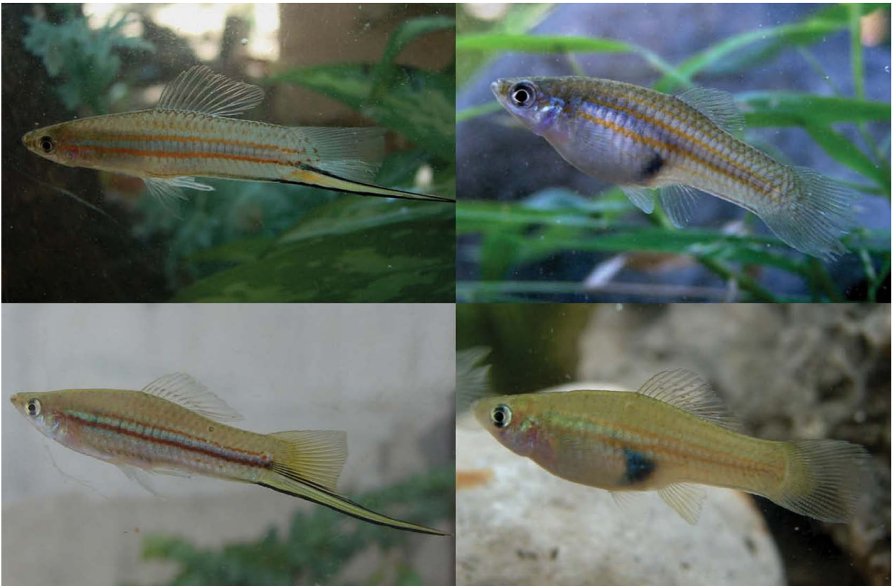
Figura 2. Xiphophorus clemenciae (superior: macho izquierda, hembra derecha) y X. hellerii (inferior: macho izquierda, hembra derecha).