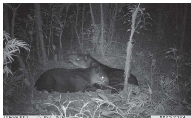
Figura 3. Dos individuos de T. bairdii , aparentemente madre y cría (M. Aranda, com. pers.; ver: https://www.dropbox.com/s/qfzbfcadse652br/Tapir.mov ), registrados en Totontepec Villa de Morelos, Oaxaca.

Al ser el tapir una especie con requerimientos de hábitat muy específicos, la presencia de esta especie puede servir como indicador del buen estado de conservación de las múltiples regiones de Oaxaca en las que recientemente se ha documentado su presencia, pero además la atención sobre esta especie podría beneficiar la conservación de algunas otras que comparten su distribución. Este estudio confirma la distribución del tapir centroamericano en la sierra Mixe de Oaxaca (Naranjo 2009; Sánchez-Hernández, 2012; Mendoza et al., 2013) y fue realizado con la participación informada de los pobladores de Totontepec Villa de Morelos, lo que resalta y demuestra que el esquema del monitoreo participativo con fototrapas es una opción viable de investigación que brinda buenas oportunidades de incrementar la información sobre la distribución de las especies (Botello et al., 2013), al tiempo que sensibiliza e involucra de las personas de las localidades en la