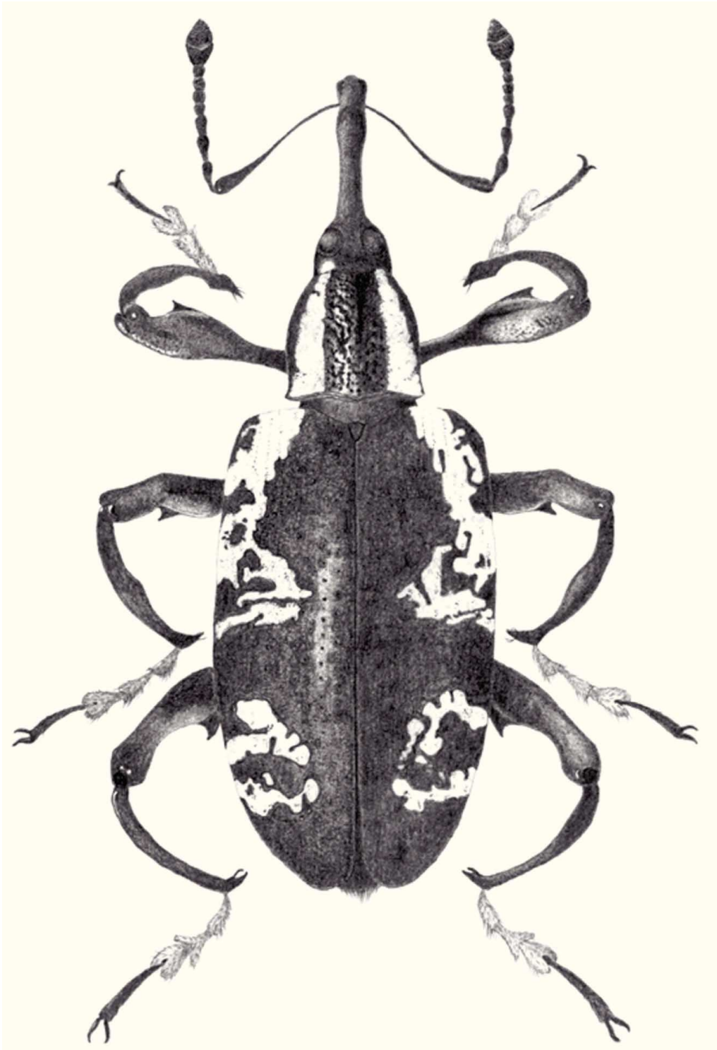
Figura 1. Heilipus albopictus (Champion, 1902) (Curculionidae: Molytinae), vista dorsal.