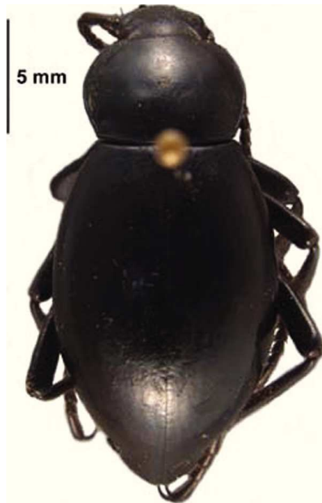
Figura 3. Eleodes curvidens Triplehorn y Cifuentes-Ruiz (subfamilia Tenebrioninae).