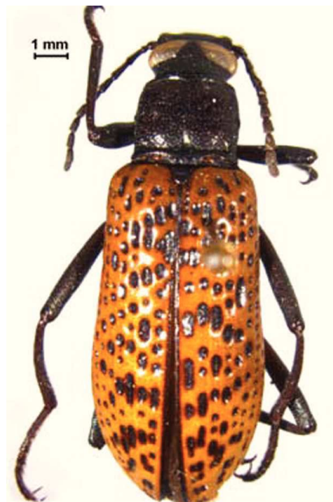
Figura 4. Strongylium cribripes Mäklin (subfamilia Stenochiinae).