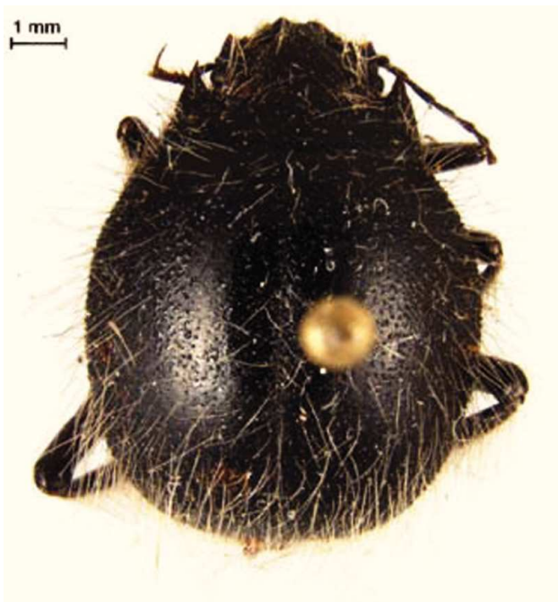
Figura 1. Edrotes ventricosus LeConte (subfamilia Pimeliinae).