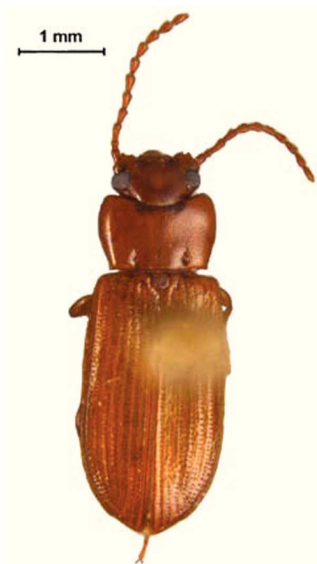
Figura 2. Adelina bifurcata Champion (subfamilia Diaperinae).