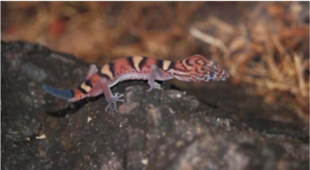
Figura 1. Coleonyx elegans nemoralis en sierra Nanchititla, México.

la literatura mostró que C. elegans nemoralis no estaba registrada para el Estado de México (Casas-Andreu y Aguilar-Miguel, 2005; Monroy-Vilchis et al. 2005).