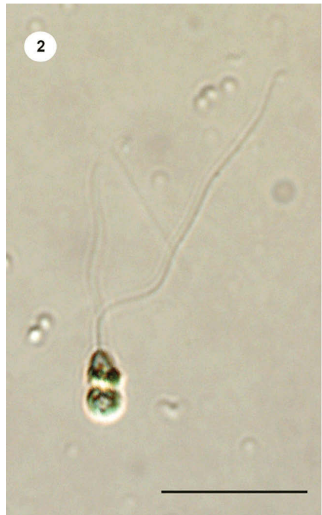
Figura 2. Aspecto general de Spermatozopsis similis al microscopio óptico. Barra escala= 10 \mu\text{m} .

Los ejemplares de S. similis presentaron células biflageladas fusiformes, levemente espiraladas. Su ancho varió entre 2 y 4 \mu\text{m} y el largo entre 2.5 y 7 \mu\text{m} . El extremo celular anterior fue redondeado y sin papila, mientras que el posterior resultó más angosto y finalizó en punta. La forma celular fue relativamente constante. Los 2 flagelos presentaron inserción apical y fueron desiguales en su longitud. El flagelo más largo presentó una extensión de entre 25 y 30 \mu\text{m} , alcanzando 5-5.5 veces la longitud celular, mientras que el corto presentó un largo de entre 10 y 15 \mu\text{m} , alcanzando 2-2.5 veces la longitud de la célula (Figs. 2 y 3).