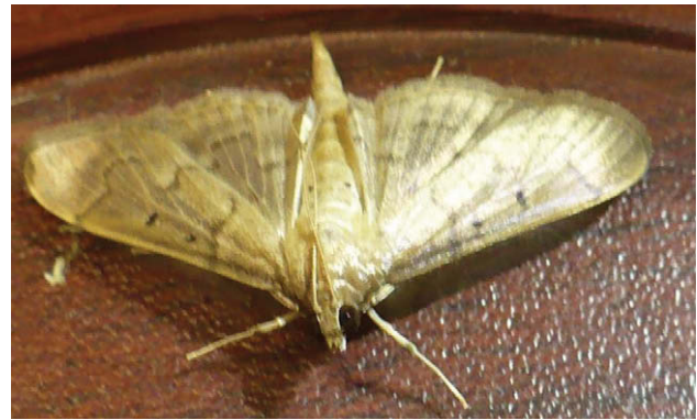
Figura 3. Adulto de Herpetogramma bipunctalis obtenido en laboratorio.

El periodo de desarrollo de las larvas fue de 22 días (1-22/10/2012), éstas fueron clasificadas como Lepidoptera: Pyraloidea: Crambidae: Pyraustinae: Spilomelini: Herpetogramma bipunctalis Fabricius (1794), con base