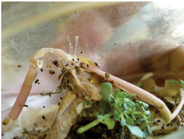
Figura 2. Larvas de Herpetogramma bipunctalis alimentándose de Alternanthera philoxeroides .

en el trabajo de Allyson (1984). La etapa de crisálida tuvo una duración de 10-11 días (22-31/10/2012), luego llegó a la etapa de adulto (Fig. 3), con la cual se corroboró la determinación taxonómica de H. bipunctalis , utilizando las claves del género para Norteamérica (Solis, 2010).