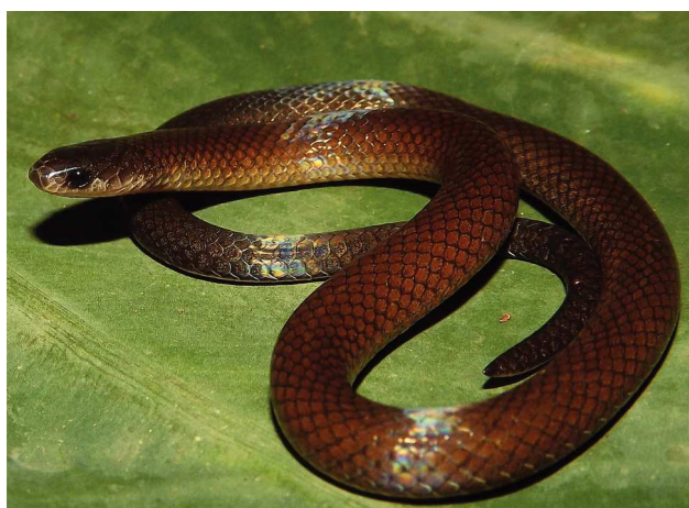
Figura 1. Ejemplar en vida de Tantillita lintoni (CARIÉ-1190) recolectado en la localidad de Arroyo Zarco, Uxpanapa, Veracruz.

94°28'3.4" O, WGS84; 356 m snm) a 4 km del límite con el estado de Oaxaca. Los 3 ejemplares fueron encontrados en microhábitats terrestres, al interior de fragmentos de selva alta perennifolia.