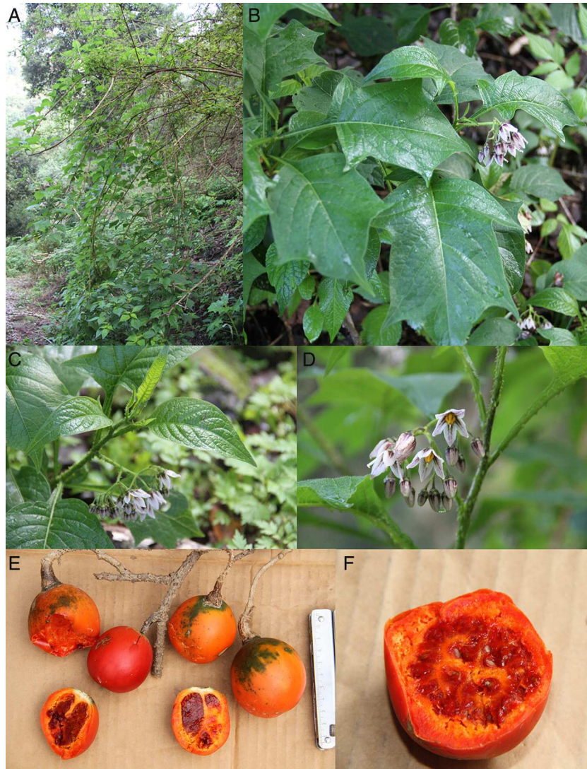
Figura 1. Solanum edmundoi Cuevas et N. M. Núñez. A, hábito de la especie; B, hojas pinnatilobadas en las que se pueden apreciar los lóbulos y la base de la lámina decurrente; C, variación de la hoja, ramillas con aguijones y ramificación de la inflorescencia; D, flores en las que se aprecia el color de la corola, los estambres iguales, y el estilo y parte del estigma (fotos del holotipo); E, frutos en los que puede observarse la variación del color, el tamaño y una sección longitudinal; F, sección transversal de un fruto (E y F, Cuevas, Topete y Solís , 11196).

R. Cuevas, L. Guzmán, E. V. Sánchez y J. G. Morales 11230 (ZEA).