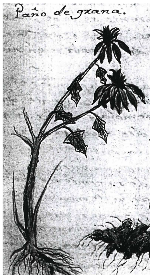
Figura 3. Nochebuena nombrada como «pañó de grana» en Historia Natural o Jardín Americano del año 1801 (Navarro, 1992). Ilustración de Euphorbia pulcherrima con inflorescencias dobles.

H: haplotipo; H_d : diversidad haplotípica; k: promedio de número de diferencias nucleotídicas; S: número de sitios segregantes; SD: desviación estándar; \theta_w : diversidad genética; \pi : diversidad nucleotídica.