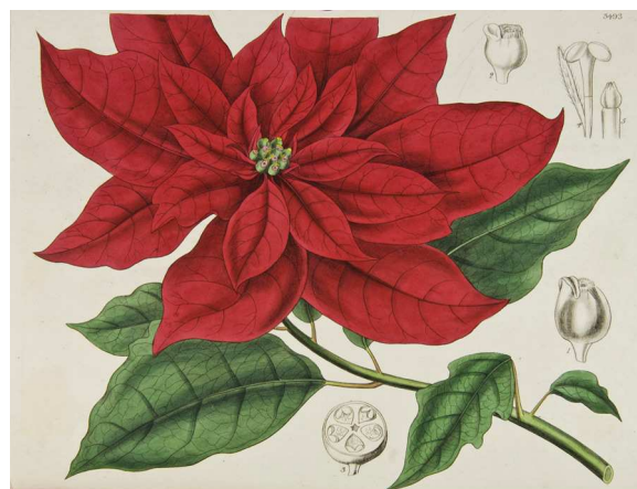
Figura 4. Ilustración botánica de nochebuena descrita como Poinsettia pulcherrima en Graham (1836b).

desde la época prehispánica en lo que es hoy el Distrito Federal (Sahagún, 1979), y la presencia de cultivares mexicanos en la Nueva España se observa en la ilustración de Navarro (1992), en la cual se dibuja una nochebuena con inflorescencias de más de una hilera brácteas (fig. 3). Incluso es posible que Joel Roberts Poinsett se haya llevado plantas con cierto grado de manejo, ya que se observan plantas con inflorescencias dobles en ilustraciones de Graham (1836b) (fig. 4). También es posible que existan variantes novedosas de nochebuenas en el Distrito