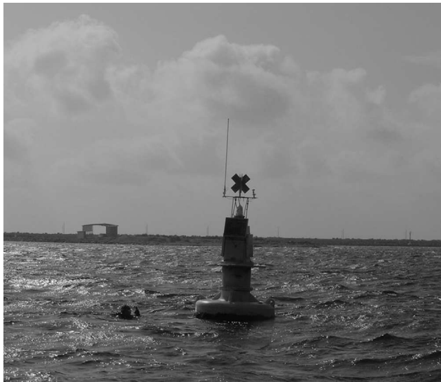
Figura 3. Boyas guía de acceso al recinto portuario API-Progreso, Yucatán.

Boeck, 1871; Ampithoe longimana Smith, 1873 (CNCR 28764); A. marcuzzii Ruffo, 1954 (CNCR 28765); A. ramondi Audouin, 1826 (CNCR 28766); familia Corophiidae Leach, 1814; Laticorophium baconi (Shoemaker, 1934) (CNCR 28767); Monocorophium acherusicum (Costa, 1853) (CNCR 28768); Monocorophium sp.; infraorden Caprellida Leach, 1814; superfamilia Caprelloidea Leach, 1814; familia Caprellidae Leach, 1814; subfamilia Caprellinae Leach, 1814; Caprella equilibra Say, 1818 (CNCR 28769); C. penantis Leach, 1814 (CNCR 28770); Paracaprella pusilla Mayer, 1890 (CNCR 28771); superfamilia Isaeoidea Dana, 1852; familia Isaeidae Dana, 1852; Photis longicaudata (Bate y Westwood, 1862) (CNCR 28772); Photis sp.; superfamilia Photoidea Boeck, 1871; familia Ischyroceridae Stebbing, 1899; Erichthonius punctatus (Bate, 1857) (CNCR 28774).