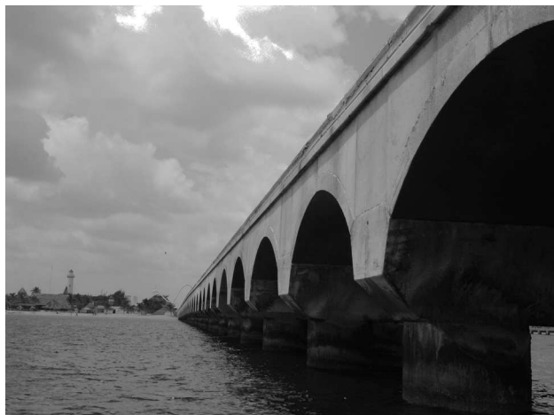
Figura 4. Pilotes del viaducto-muelle del recinto portuario API-Progreso, Yucatán.

Suborden Gammaridea Latreille, 1803; familia Ampeliscidae Costa, 1857; Ampelisca schellenbergi Shoemaker, 1933 (CNCR 28775); familia Colomastigidae Stebbing, 1899; Colomastix