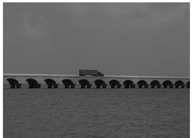
Figura 2. Viaducto-muelle del recinto portuario API-Progresso, Yucatán.

1988) (CNCR 28760); Lembos websteri Bate, 1857 (CNCR 28761); Plesiolembos ovalipes (Myers, 1979) (CNCR 28762); Plesiolembos rectangulatus (Myers, 1977) (CNCR 28763); superfamilia Corophioidea Leach, 1814; familia Ampithoidae