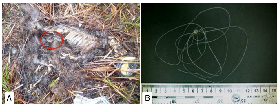
Figura 3. A) Cadáver de N. olivacea encontrado en un sendero natural. Páramo de la Cabrera, PNN Tamá, Norte de Santander, Colombia. B) Trozo de plástico encontrado dentro del contenido estomacal de N. olivacea (véase el círculo rojo en la figura 3A). El color de esta figura solo puede apreciarse en la versión electrónica del artículo.

sp., además de semillas de Miconia sp., Macleania sp., Prestoea sp., y Geonoma sp., especies comunes en la dieta de esta especie (Figuroa, 2013a, 2013b; Figuroa y Stucchi, 2009; Ontaneda y Rivera, 2012; Ríos-Uzeda, Villalpando, Palabral, y Álvarez, 2009; Rivadeneira-Canedo, 2008) (fig. 2A). Sin embargo, esta hez también presentó fragmentos de un polímero sintético de pequeño tamaño, el cual no había sido registrado en estudios previos de su dieta (fig. 2B).